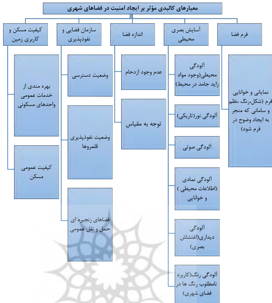
معیارهای کالبدی مؤثر بر ایجاد امنیت در فضاهای شهری از دیدگاه رویکرد CPTED