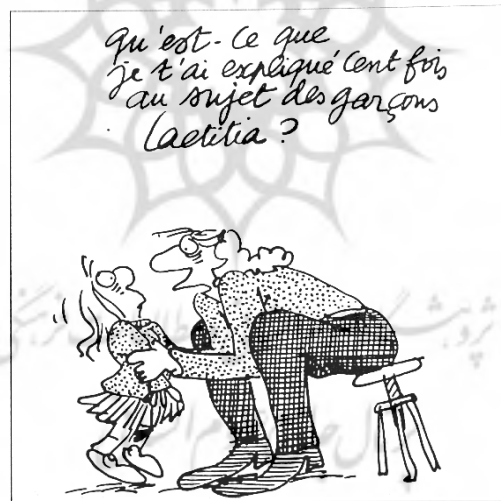
Claire Bretécher, Frustrés 4 , p. 23, © Claire Bretécher, 1977.