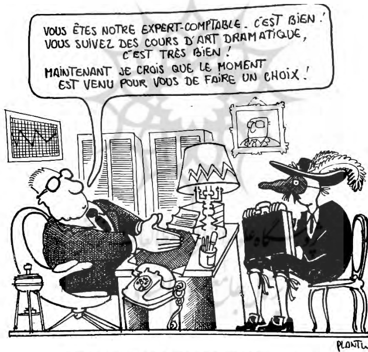
Plantu, Wolfgang, tu feras informatique , p. 103, La Découverte/Le Monde, 1988.