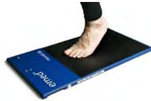
تصویر ۱. نحوه قرارگیری پا در وسط پلت فرم و نمایش فشار کف پا از طریق نرم افزار