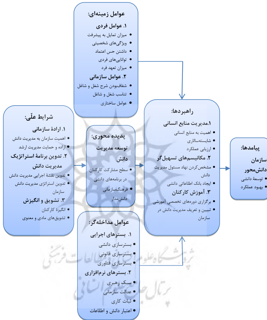
شکل ۱- الگوی پارادایمی توسعه مدیریت دانش