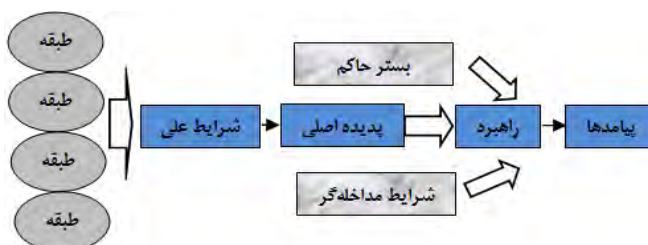
شکل ۱. مدل پارادایمی کدگذاری محوری

شده است) است. گام سوم، مرتبط ساختن مقولات به یکدیگر در سطح بعدی است. گام چهارم، به تأیید رساندن آن روابط در قبال داده‌ها است. آخرین قدم، تکمیل مقولاتی است که اصلاح و یا نیاز به بسط و گسترش دارند (دانایی فر و همکاران، ۱۳۸۹: ۱۱۲). در شکل شماره ۲ مسیر انجام و تکمیل تجزیه و تحلیل داده‌ها در تحقیق حاضر آمده است: