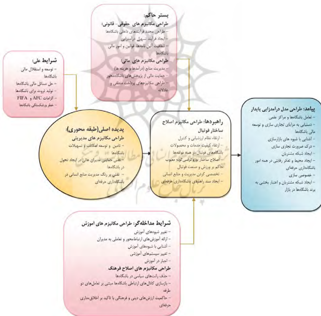
نمودار ۱. کدگذاری محوری بر اساس مدل پارادایم

ضرورت‌های توسعه باشگاه‌های فوتبال کشور، توجه به تجاری سازی آنها به مانند سایر شرکت‌ها و سازمان‌های تجاری شده می‌باشد که این امر در راستای حل مسائل مالی باشگاه‌های فوتبال است (P1). بدین منظور لازم است که مدیران شرایط لازم را برای فعالیت‌های تجاری‌سازی باشگاه‌های فوتبال فراهم کرده و از ایده‌های نوآورانه در زمینه حل مسائل باشگاه‌ها به خصوص اخذ مؤلفه‌های مالی حمایت‌های لازم را به عمل آورند (P2). با وجود حمایت‌های مدیران، می‌توان با انجام مطالعات تطبیقی، و یا استفاده مطلوب از نتایج پژوهش‌های انجام شده در زمینه صنعت فوتبال اقدام به اصلاح ساختار فوتبال نموده و مقدمات توسعه باشگاه‌های فوتبال را فراهم آورد. همچنین از الزامات حمایت از فعالیت‌های