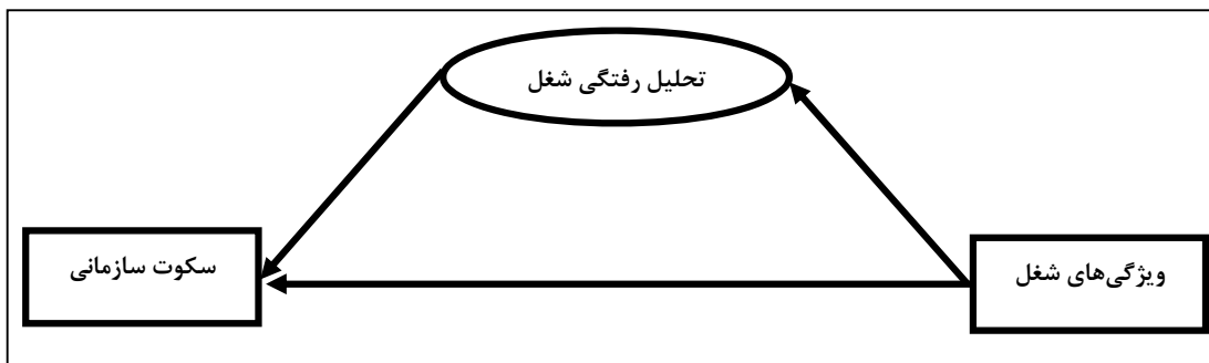
شکل ۳. نقش میانجی تحلیل رفتگی شغل در رابطه بین ویژگی‌های شغل و سکوت سازمانی

اهمیت وظیفه نیز به خوبی احساس می‌شود. البته، ویژگی اهمیت وظیفه مانند شمشیر دو لبه عمل می‌کند. ممکن است گاهی موجب افزایش پیامدهای مثبت شغلی شود (رضانی‌نژاد و همکاران، ۱۳۹۳، الف)، اما گاهی اوقات می‌تواند به دلیل حساسیت کار و تأثیر عملکرد شغلی بر زندگی سایر افراد مانند ارباب‌رجوع، تماشاگران، خانواده و غیره، عوارضی از قبیل کناره‌گیری و ترک شغل را موجب شود (رضانی‌نژاد و همکاران، ۱۳۹۳، ب).