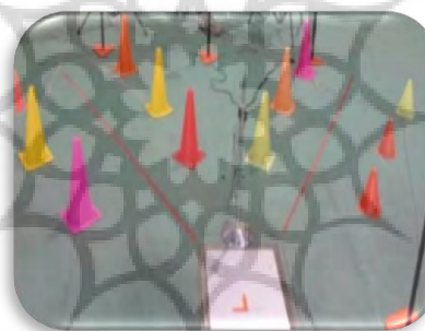
شکل ۲- الف: نمای کلی از آزمون تغییر جهت شکل ۲- ب: مسیر تغییر جهت با زاویه ۴۵ درجه

داده‌های سینتیک جمع‌آوری شده با استفاده از تکنیک باترورث درجه چهار با فرکانس برشی ۵۰ هرتز (۱۷) فیلتر شدند و این داده‌های فیلتر شده برای محاسبه متغیرها مورد استفاده قرار گرفتند. به منظور تسهیل در مقایسه داده‌ها، نیروی عکس‌العمل در تمام جهت‌ها طی مرحله ایستایی محاسبه گشت و مطابق با وزن بدن نرمال گردید. شایان توجه است که چرخه به‌عنوان یک سیکل از تماس اولیه پا تا جداشدن انگشت با استفاده از داده‌های صفحه نیرو شناسایی شد (۲۰-۱۸) و مؤلفه‌های نیروی عکس‌العمل زمین در تابع فرکانس با استفاده از تبدیل فوریه ۱ مورد محاسبه قرار گرفت (۱۶، ۱۵).