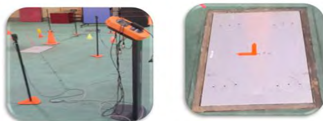
شکل ۱- الف: صفحه نیرو شکل ۱- ب: ابزار سنجش چابکی واکنشی

آزمون تغییر جهت جانبی شامل پنج متر دویدن و سپس، 5 \pm 45 درجه تغییر جهت به سمت پای غالب یا غیرغالب بود (شکل شماره دو - الف). شایان ذکر است که تعدادی مخروط در زاویه ۳۵ و ۵۵ درجه از شروع تغییر جهت قرار داده شد تا فرد را به سمت برش ۴۵ درجه هدایت کند (شکل شماره دو - ب).