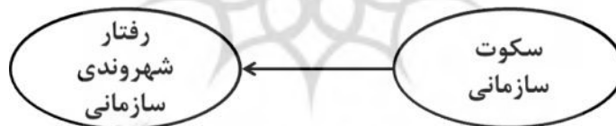
شکل شماره ۱. مدل مفهومی پژوهش

مدل مفهومی، الگویی براساس روابط تئوریک میان عوامل و متغیرهای اثرگذار بر موضوع مورد مطالعه است. همان‌طور که توضیح داده شد متغیرهایی که در این پژوهش مورد بررسی قرار می‌گیرند، سکوت سازمانی و رفتار شهروندی سازمانی بر گرفته از ادبیات پژوهش‌اند (مدل مفهومی در شکل شماره ۱. نشان داده شده است).