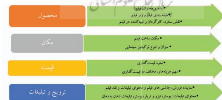
شکل ۵. آمیخته بازاریابی فیلم و اجزای آن

در این مقاله تلاش شد ضمن مرور کلی مفهوم بازاریابی فیلم و سهم یاری‌های اساسی دانش بازاریابی به حوزه فیلم و سینما، به شکل تفصیلی به نکات و تکنیک‌های مرتبط با آمیخته‌های چهارگانه بازاریابی فیلم اشاره شود. شکل ۵ آمیخته بازاریابی فیلم و اجزای آن را، که به صورت تطبیقی در این مقاله مطرح و بررسی شد، نشان می‌دهد.