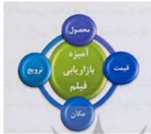
شکل ۵. آمیخته بازاریابی فیلم

هر کمپانی فیلمسازی نیازمند ابزاری است که بتواند تقاضا برای محصولش را تحت تأثیر قرار دهد. کاتلر و آرمسترانگ (Kotler & Armstrong) آمیخته بازاریابی را مفهومی قابل کنترل می‌دانند که کمپانی‌ها از آن برای به دست آوردن پاسخ مطلوبشان از بازار هدف موردنظر استفاده می‌کنند (Kotler & Armstrong, 2014: 51) در ادامه به بررسی اجزای آمیخته بازاریابی فیلم می‌پردازیم.