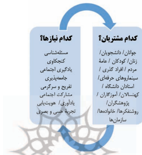
شکل ۲. بخش‌بندی مشتریان فیلم و سینما براساس نیازهای آنها

خوب بازیگرانش فیلم را ببینند. مهم این است که هر فیلم و هر سینما همواره سعی کند تجارب خاص و منحصر به فردی را ارائه کند، که در دیگر روش‌ها یا مکان‌های گذران اوقات فراغت نمی‌توان آن را یافت.