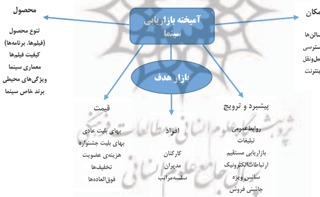
شکل ۴. آمیخته بازاریابی سینما (5p)

پیش از طرح موضوع "آمیخته بازاریابی فیلم" تلاش می شود این مفهوم به صورت تطبیقی در ارتباط با سینما مطرح شود. سینماها نیز مانند هر سازمان دیگری، برای تحقق مأموریت های خود، نیازمند برنامه ریزی هستند. به همین دلیل، نیاز به بخش بندی مشتریان خود، هدف گیری مشتریان منتخب، و تعریف ارزش هایی متناسب با مشتریان گروه های هدف دارند. از این دیدگاه، بازاریابی ترکیبی از فعالیت های مشهور به 5P است که از آنها با نام های آمیخته بازاریابی، ترکیب بازاریابی، ابزارهای بازاریابی، و یا تاکتیک های بازاریابی هم یاد می کنند و در شکل ۴ نمایش داده شده اند.