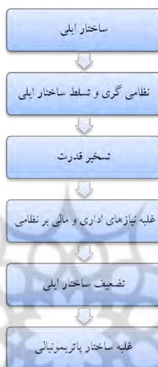
شکل شماره ۳ روند غلبه ساختار پاتریمونالی بر ساختار ایلی در ایران

از یک سو و کشمکش دائمی میان عناصر ایلی و عناصر دیوانی غیر ایلی باقی مانده از سلسله‌های پیشین بود.