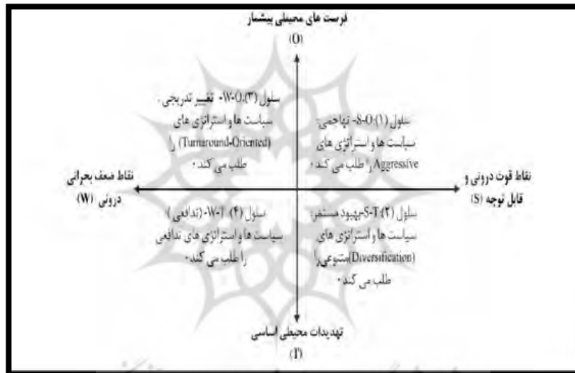
شکل ۱- نمودار تجزیه و تحلیل سوات (Wright,1998)