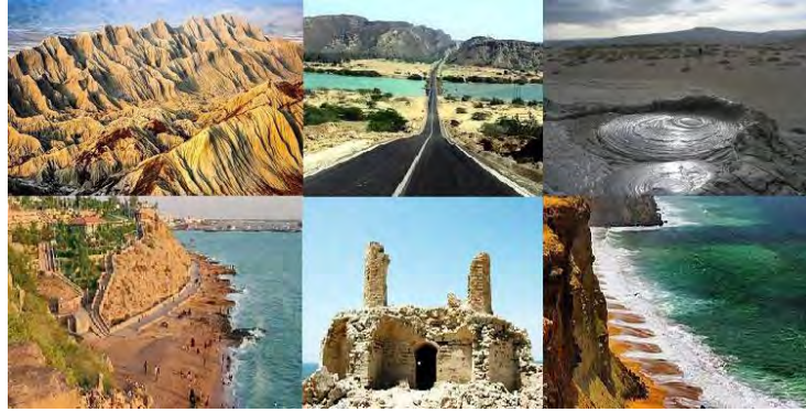
شکل ۳- نمونه هایی از جاذبه های گردشگری چابهار