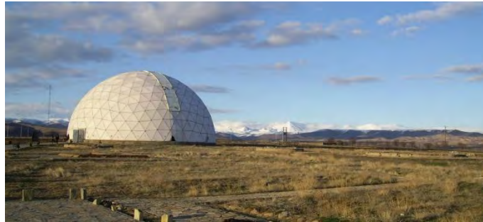
تصویر شماره ۴- نمایی از رصد خانه مراغه . بهار ۱۳۹۷.

مراکز مهم دنیای آن روز مبدل گشت. ۱ در زمان مغولان آذربایجان به ۹ منطقه تقسیم که جمعا ۲۷ تا شهر داشت. رصد خانه مراغه یکی از یادگارهای علمی و فلکی خواجه نصیر الدین طوسی فیلسوف ریاضیدان و منجم بزرگ دوره ایلخانی است که به دست او و با عده ای از فضلا و دانشمندان در سال ۶۵۷ هجری بنا شده است. این رصد خانه زمانی مشهورترین رصد خانه های اسلامی بوده است که آوازه آن تمام جهان آن روز را فرا گرفته است و تاکنون با این همه تغییرات و تحولات که در جهان پدید آمده است هنوز هم نام رصدخانه و بانی آن بر سر زبان ها می باشد.