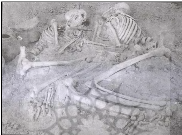
تصویر شماره ۳- نمونه ایی از گورهای کشف شده در محوطه مسجد کبود تبریز (سرداری نیا، ۱۳۸۷: ۱۹)

این زمینه می نویسد: آذربایجان با وجود اهمیت و قدمت تاریخی که در تمدن مشرق قدیم و ایران دارد و از روزگاران کهن از طریق دربند، باب الابواب و آسیای صغیر سر راه اقوام مختلف و پلی بین ماورای قفقاز، ایران و بین النهرین بوده است و اقوام از یاد رفته و به یاد مانده ای چون آشوریها، اورارتو، ماننایی، میتانی، سکایی، کیمری، هیتی، کاسی، مادی و پارسی در آن می زیستند، هنوز آنچنان که شایسته است در آنجا کاوش و تحقیقات علمی به عمل نیامده است و با آن که گنج هایی از ذخایر و آثار مدنی و هنری پیشینیان به تحقیق در زیر خاک آن پنهان است متأسفانه تاکنون مانند بیشتر نقاط ایران تاریخ قدیم آن در طاق نیسان مانده است. به عنوان مثال حفاری های محوطه مسجد کبود تبریز در سال های اخیر که از سوی شهرداری تبریز نه برای اکتشافات علمی بلکه جهت ساختمان سازی انجام می شد سبب کشف مقابر متعددی گردید که قدمت تاریخ تبریز را تا بیش از ۳۵۰۰ سال پیش برد. (سرداری نیا، ۱۳۸۷: ۱۸)