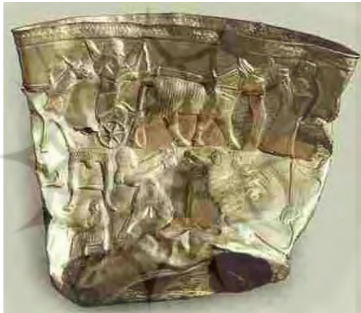
تصویر شماره ۲- جام طلای حسنلو، تاریخ کشف ۱۳۳۶، جنس طلا، وزن ۹۵۰ گرم، اندازه ۲۱ سانتیمتر بلندی و ۲۵ سانتیمتر قطر، محل نگهداری موزه ایران باستان.

آغاز عصر آهن در آذربایجان از اوایل نیمه اول هزاره قبل از میلاد می باشد که پیدایش آهن اسکان بنا گذاری تمدن امروزی را به وجود آورد. در حدود اواخر هزاره چهارم و اوایل هزاره سوم، بازرگانی و شهرنشینی در آذربایجان توسعه یافت و پول بعنوان مقیاس ارزش و وسیله گردش پدیدار گشت. نقش زن در این دوره در آذربایجان به جهت تضمین بقای طایفه و حفظ بستگی های خونی و چه به سبب پرداختنشان به میوه چینی و گردآوری گیاهان و نیز اشتغال به امر کشاورزی و تامین مواد غذایی و نگهداری آن و هم چنین ساختن ظروف سفالین و حفظ آتش داری، نقش قابل توجهی داشت و این وظایف و عملکرد برای زن موقعیت ممتازی را در بین افراد طایفه فراهم آورد. اما همین که دامداری و کشاورزی توسعه یافت و به شاخه اصلی اقتصاد مبدل شد ارزش مردسالاری در جامعه رشد یافت.