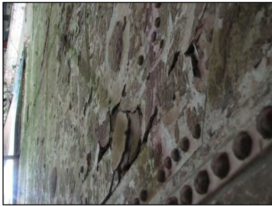
شکل ۳: فرسوده شدن و از بین رفتن بخش های زیادی از لایه آستر و شکستگی، ترک خوردگی و ریختگی بخش هایی از لایه بستر و ضعف اتصال آرایه های گچی قالبی به زمینه بستر

Fig. 3: Wearing out and destroying large parts of the Scratch coat and fracture, crackling and casting parts of the Fine coat and the weakness of bonding gypsum arrays to the ground