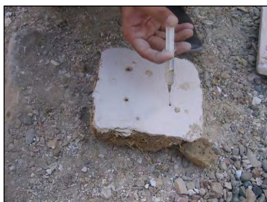
شکل ۴: نمونه‌سازی و شبیه‌سازی لایه‌های تکیه‌گاه، آستر، بستر و تزریق مواد استحکام‌بخش بین لایه‌ها layers of Fig: 4: Sample construction and simulation support, Scratch coat, Fine coat and Injection of reinforcing materials between layers

مرحله بعد، تزریق و اجرای ملات گچ به لایه‌های زیرین است. برای این کار از گچ بومی منطقه یزد و پودر سریش (جهت بالاتر بردن استحکام و همچنین کندگیر کردن ملات گچ) استفاده شد (شکل ۶؛ Fig: 6). اجرای این مرحله از حساسیت بالایی برخوردار است. عملیات