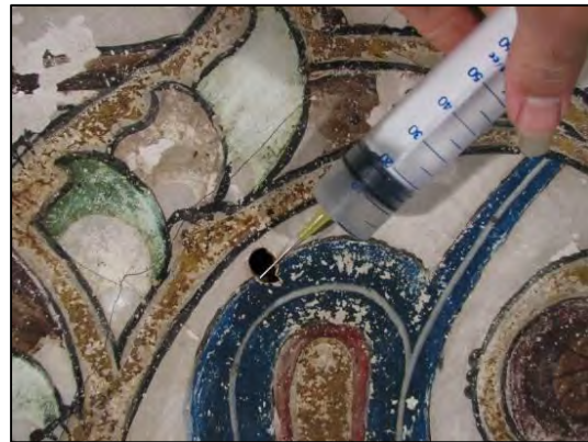
شکل ۵: تثبیت پشت و روی لایه بستر سقف گنبد بقعه سید رکن‌الدین Fig: 5: Stabilization of back and forth of fine coat in dome roof of Rokn al-Din mausoleum

است و همچنین این ملات مانند یک میخ، لایه بستر گچی را به لایه‌های زیرین متصل می‌نماید (شکل ۷؛ Fig: 7). پس از اتمام عملیات تزریق ملات گچ به پشت لایه بستر و داخل حفره ایجادشده در لایه تکیه‌گاه، عملیات تمیزکاری سطح رویی لایه بستر انجام گرفت. روش اجرایی در این پروژه اصطلاحاً روش استفاده از «میخ گچی» نام‌گذاری شد. زیرا ملات گچ مانند یک میخ، لایه بستر را به لایه تکیه‌گاه متصل نموده و شبیه به میخ عمل می‌کند. اجرای میخ‌های گچی با فاصله‌های نسبتاً معین