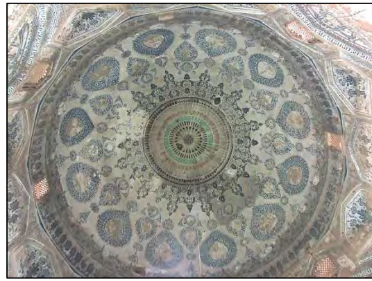
شکل ۲: آرایه های معماری سقف گنبد بقعه سیدرکن الدین Fig. 2: Architectural arrays of dome roof of Rokn al-Din mausoleum

یکی دیگر از مشکلاتی که برای مرمتگر وجود خواهد داشت، این است که پر کردن فضای خالی پشت لایه بستر گچی، بدون در نظر گرفتن میزان استحکام این لایه بسیار نازک، باعث جدا شدن و فروریختن لایه بستر و آرایه های اجرا شده بر روی آن در قسمت سقف گنبد، (با توجه به نیروی جاذبه زمین) خواهد شد. همچنین در بسیاری از قسمت ها، بر روی لایه بستر گچی بسیار نازک (از نظر ضخامت) که پشت آن نیز خالی است، آرایه گچی قالبی اجرا شده است که در طی ۷۰۰ سال گذشته، اتصال این آرایه های گچی با زمینه، بسیار کم شده و در حال جدا