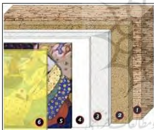
شکل ۱: طرح کلی از لایه‌های یک دیوارنگاره: ۱. تکیه‌گاه ۲. آستر ۳. بستر ۴. بوم‌کننده ۵. لایه رنگ ۶. ورنی

Fig. 1: Schematic picture of the layers of a wall paintings: 1. Support 2. Scratch coat 3. Fine coat 4. Primary layer 5. Paint layer 6. Varnish