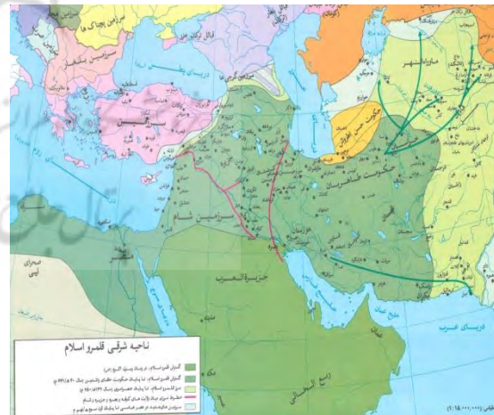
(مونس، ۱۳۸۵: ۲۶۲)

اطلس تاریخ اسلام اثر حسین مونس از مشهورترین و معتبرترین اطلس‌های عربی است که نقشه‌های آن بیانگر سیر گسترش اسلام در همه مناطق جهان است. بخشی از نقشه‌های این اطلس به دولت‌های اسلامی مستقر در ایران اختصاص یافته است. با این که مونس در نخستین نقشه مربوط به ایران به حکومت طاهریان، توجه نشان داده اما وی سیر گسترش اسلام در طول ۲۰۰ سال نخست را با حوزه قلمرو طاهریان در یک نقشه ترسیم کرده است. همین مسأله سبب شده تا نقشه وی ترکیبی و کلی و فاقد دقت لازم شود.