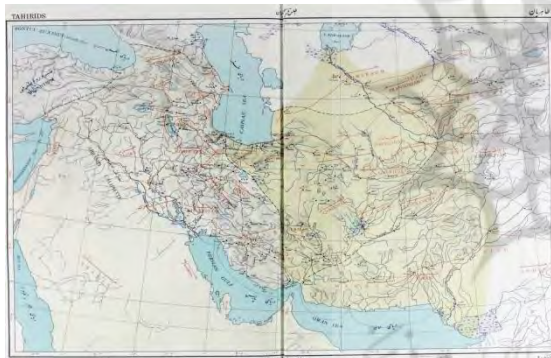
(اطلس تاریخی ایران، ۱۳۵۰: ۹)

اطلس تاریخی ایران، نخستین اطلس بزرگ ایرانی است که در سال ۱۳۵۰ با همکاری گروهی پرشمار از پژوهشگران معاصر تدوین شد. یک نقشه از این مجموعه به جغرافیای تاریخی حکومت طاهری اختصاص یافته است. اطلس ملی ایران که در سال ۱۳۷۸ ش توسط سازمان نقشه‌برداری کشور تهیه و منتشر شد نیز در بیشتر موارد مبتنی بر الگوی نقشه‌های اطلس یادشده است.