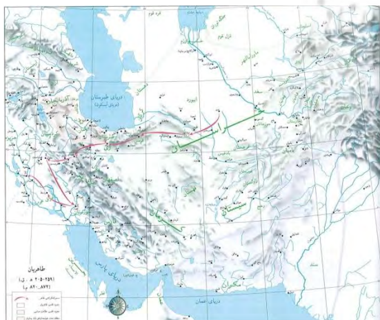
(سازمان نقشه‌برداری کشور، ۱۳۷۸: ۵۹).

کتاب جغرافیای مرز، نقشه‌های دو اطلس قبلی را با