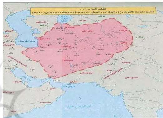
(اخباری و نامی، ۱۳۸۸: ۱۰۴).

ابعاد کوچکتر و با وضوح بیشتر در خود جای داده است. این کتاب در قطع وزیری به چاپ رسیده و نقشه‌های آن بسیار واضح و گویاست. وضوح این نقشه‌ها به دلیل زمینه کدر و رنگ صورتی محدوده قلمرو حکومت‌هاست و به همین جهت مرجع مناسبی برای پژوهشگران جغرافیای تاریخی است. نقشه تاریخی حکومت طاهریان که در ادامه می‌آید برگرفته از این کتاب است.