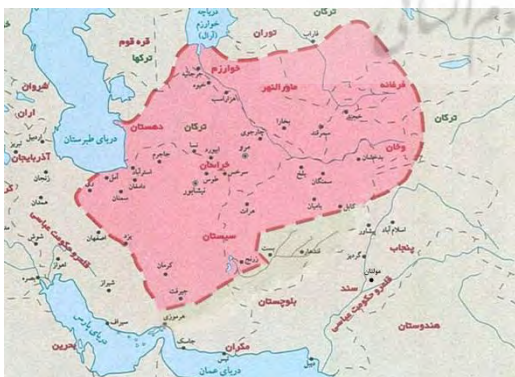
(نقشه پیشنهادی جدید برای مرزهای تصحیح شده حکومت طاهریان بر پایه نقشه موجود در کتاب جغرافیای مرز)

عصر عبدالله بن طاهر اختلاف نظری ندارند. شهرهای تابع حکومت طاهری در این دوران اوج در گزارش ابن خردادبه به صورت جزئی و دقیق شناسایی شده‌اند (ابن خردادبه، ۱۸۸۹: ۳۴-۳۷). در نقشه طاهریان در اطلس‌های ایرانی شهرهای بست، قندهار و مولتان در شمار شهرهای تابع طاهریان قلمداد شده است؛ در حالی که بر اساس گزارش منابع مکتوب کهن و استدلال‌های ارائه شده در این مقاله، به ویژه در بخش سرحدات شرق و جنوب شرقی، شهرهای پیش‌گفته را نمی‌توان متعلق به جغرافیای سیاسی طاهریان دانست. همچنین در گزارش ابن خردادبه نام جزیره هرموزی در میان شهرهای باج‌گزار حکومت طاهریان وجود ندارد و نمی‌توان نقشه‌های موجود که مرزهای طاهریان را تا این بندر امتداد داده‌اند مستند دانست. بر این اساس نقشه دیگری طراحی و پیشنهاد شده است که مرزهای شرقی و جنوب شرقی حکومت طاهریان در آن تصحیح و بازترسیم شده است. لازم به توضیح است که نقشه پیشنهادی، برگرفته از نقشه طاهریان موجود در کتاب جغرافیای مرزهاست که با اندکی اصلاحات در بخش جنوب شرقی آن، دوباره ترسیم شده است.