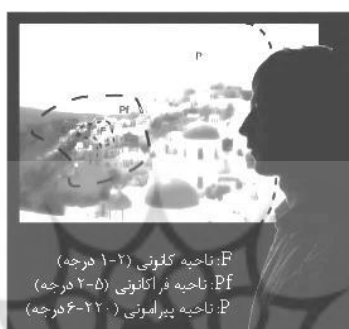
تصویر ۱. میدان دید انسان (برگرفته از Tobii Technology AB, 2010)

آنها ایجاد می‌شوند (Schotter, Angele, & Rayner, 2012). مقدار زمانی که صرف نگاه به یک مکان خاص می‌شود را مدت خیره‌شدگی می‌نامند (Richardson, Dale, & Spivey, 2007). چشم، پیام (علامت) دیداری را تا هنگام انجام یک پرش به مغز منتقل نمی‌کند. بنابراین یک پرش از هر بار اطلاعاتی که از یک خیره‌شدن به دست می‌آید، تشکیل می‌شود و خیره‌شدن بعدی برای مشاهده بیشتر اطلاعات در جای دیگر ضروری هستند. به همین دلیل، روانشناسی تجربی پرش‌ها را هنگام شروع، هنگام فرود آمدن و مدت زمان باقی ماندن آنها اندازه می‌گیرد؛ چرخه ادراک-عمل رفتار پرشی، منحصرأ اطلاعاتی برای روانشناس تجربی (آزمایشگاهی) ایجاد می‌کند (Schotter, Angele, & Rayner, 2012).