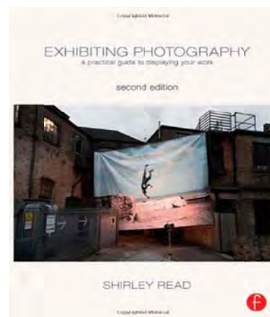
طرح جلد کتاب چاپ دوم سال ۲۰۱۴

به نظر می‌رسد برخی مطالب کتاب می‌توانست مختصر و کوتاه‌تر بیان شود و از تکرار همان مطالب در بخش‌های بعد خودداری کرد؛ هرچند باز تکرار مطالب موجب تمرکز بر روی بحث اصلی می‌شود، اما مطلب را نیز بی‌جهت طولانی می‌کند. برای نمونه می‌توان از آورده‌های تقریباً تکراری در صفحه‌های ۱۴۵ تا ۱۵۴ نام برد که به موارد تکرار شده راجع به جمع‌آوری حامیان مالی و معنوی پرداخته است، در حالی که در صفحه‌های قبل و بعد نیز به آن موارد نیز اشاره شده و می‌شود. همین‌طور آورده‌های صفحه‌های ۲۸۷ و ۲۸۸ راجع به آویختن تصویر که در صفحه‌های ۱۶۲ و ۱۶۳ و ۱۶۴ و ۱۶۵ و ۱۶۶ و ۱۶۷ به گونه‌ای دیگر تکرار شده است.