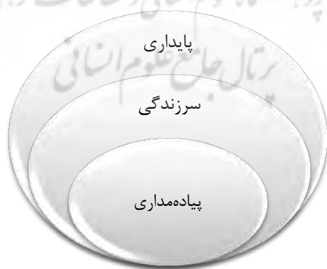
شکل ۱. ارتباط پایداری، سرزندگی و پیاده‌مداری