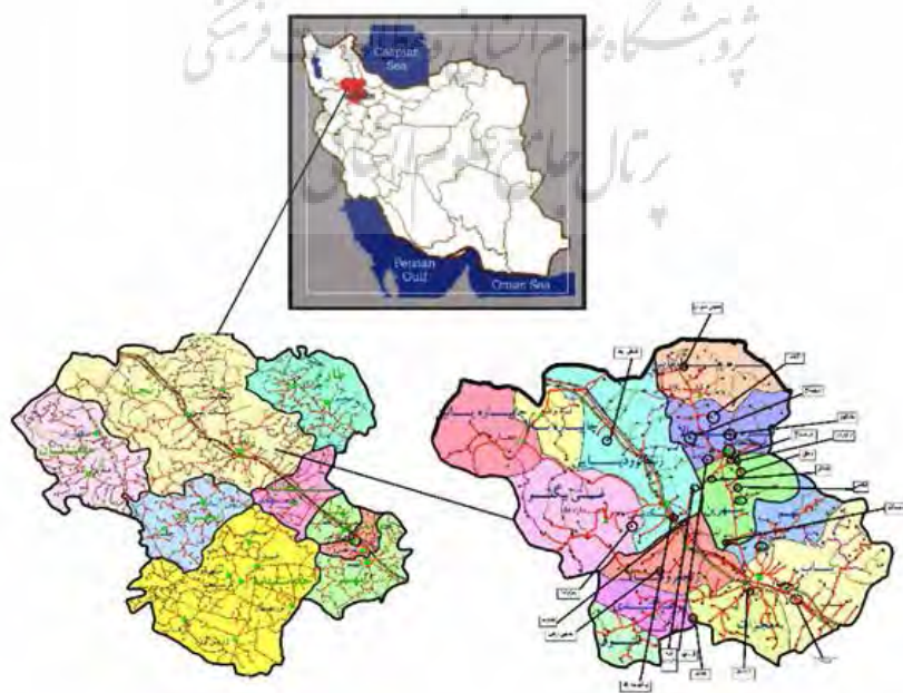
تصویر ۱. موقعیت جغرافیایی روستاهای مورد مطالعه