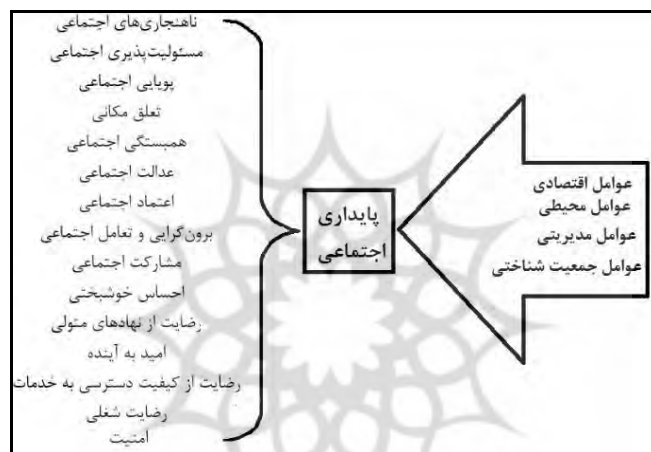
شکل ۱- مدل مفهومی پژوهش

جمینی، نظری و جمشیدی (۲۰۱۴) در پژوهشی به بررسی عوامل تبیین‌کننده پایداری اجتماعی در بین زنان روستایی ایران پرداخته‌اند. نتایج پژوهش نشان داد پنج متغیر درآمد شخصی، شغل، همکاری با گروه‌های ثانویه، سطح تحصیلات و درآمد سرپرست خانوار از عوامل مؤثر در تبیین پایداری اجتماعی در بین زنان روستایی ایران می‌باشند. مروری بر مطالعات صورت‌گرفته در ارتباط با پایداری اجتماعی نشان می‌دهد بیشتر این مطالعات مربوط به جوامع