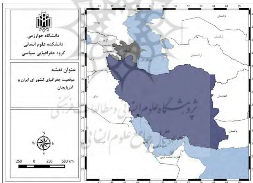
شکل (۱). موقعیت جغرافیایی ایران و جمهوری آذربایجان