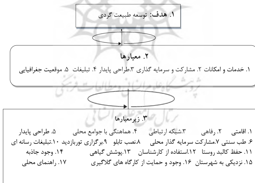
شکل (۳). ساختار شبکه‌ای علل مؤثر بر توسعه طبیعت گردی در روستاهای بخش بزرک

۱- ساخت مدل و تبدیل مسئله (موضوع) به یک ساختار شبکه‌ای (شکل ۳).