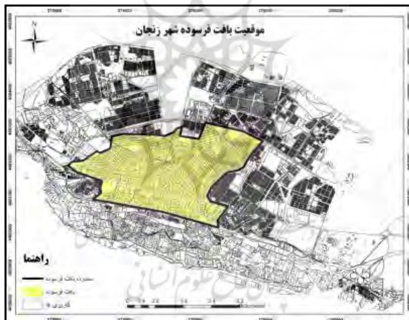
شکل (۱). موقعیت بافت فرسوده شهر زنجان (ترسیم نگارندگان، ۱۳۹۵)

قطعات ۸- شبکه‌های محلی غیررسمی موجود در محلات مانند صندوق‌های قرض الحسنه، خیریه‌ها و هیات‌های مذهبی که گاه‌آوازه جهانی دارند (مثل حسینیه اعظم زنجان) ۹- وجود مساجد مختلف و کارگاه‌های صنایع دستی که از قدیم‌الایام باعث پویایی ارتباطات و خیرخواهی در مقابل منفعت‌طلبی شخصی شده است. ۱۰- تأسیسات زیربنایی نامناسب ۱۱- مشکلات زیست محیطی و بالابودن حجم آلودگی ۱۲- کمبود امکانات گذران اوقات فراغت ۱۳- فقر و محرومیت ۱۴- آسیب‌پذیری در برابر زلزله ۱۵- سرانه کم خدمات ۱۶- تراکم جمعیت بالا ۱۷- ناامنی و معضلات اجتماعی. همچنین طبق شاخص‌هایی که توسط شورای عالی شهرسازی و معماری صورت گرفته، ویژگی‌های بافت فرسوده سه مولفه (ناپایداری، نفوذناپذیری و ریزدانگی) هستند و هر سه مورد در بافت فرسوده شهر زنجان دیده می‌شود.