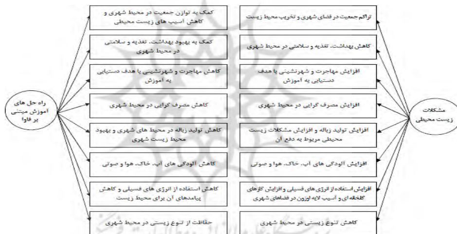
شکل ۳. راه حل‌های آموزشی مبتنی بر فاوا در کاهش مشکلات زیست محیطی

رویه جمعیت و کاهش و نابودی منابع طبیعی در مناطق شهری و به تبع آن بروز پی در پی بحران‌های زیست محیطی، به کارگیری آموزش مبتنی بر فاوا با ویژگی‌هایی که دارد را می‌طلبد که می‌تواند تا حدی راه‌گشای کاهش برخی از مشکلات، در این زمینه باشد. لذا اگرچه توسعه آموزش مبتنی بر فاوا با اهداف دیگری شکل گرفته است و اهداف خاصی را نیز دنبال می‌کند، اما می‌توان از آن در ایجاد موازنه زیستی و رفع معضلات محیطی بهره گرفت زیرا این نظام آموزشی با ویژگی‌های منحصر به فرد انعطاف زمانی و مکانی، سبب حذف بعد مسافت و در نتیجه کاهش مهاجرت از شهرها به روستاها با هدف دستیابی به نظام آموزش و پرورش می‌شود و افزایش مهارت و دانش روستائیان از طریق این نظام آموزشی، خود