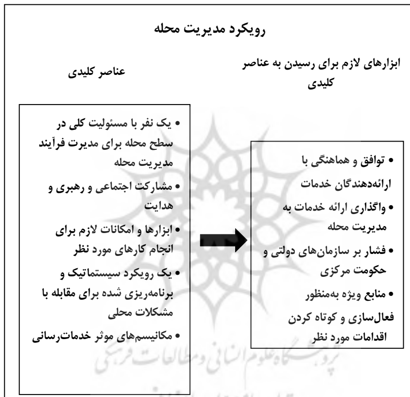
شکل (۱) رویکرد مدیریت محله

نقاط قوت خود را تقویت کرده و به مقابله با چالش‌های جدید بپردازند ( Report of the ) (Local Services and Community Safety, 2011: 7).