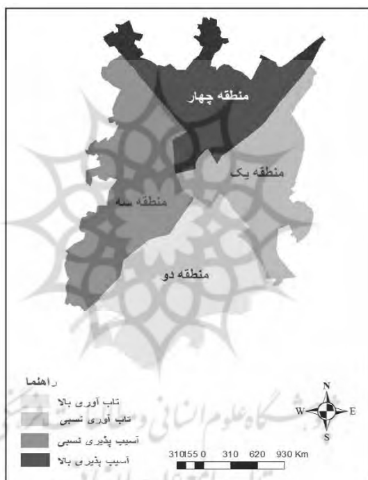
شکل شماره ۴ وضعیت تاب‌آوری مناطق چهارگانه شهر اردبیل

و چهار بالای ۲۰۰ نفر با ساختمانی یک طبقه و متراژ پایین (ریزدانه کمتر از ۷۵ متر مربع) است. از لحاظ دسترسی به مراکز امداد و نجات هم می‌توان گفت که دسترسی در منطقه یک بهتر از مناطق سه و چهار و بدتر از منطقه دو می‌باشد. منطقه یک دارای یک مرکز آتشنشانی با تعدادی شیر آتشنشانی و ۳ بیمارستان و دسترسی نسبتاً مناسب به مراکز هلال احمر دیگر مناطق برخوردار است. و منطقه سه و چهار هر کدام دارای یک بیمارستان و یک مرکز آتشنشانی با تعداد محدودی از شیرهای آتشنشانی می‌باشند. در خصوص مناطق سه و چهار شهر اردبیل می‌توان گفت که این مناطق دارای بافت فرسوده زیادی هستند و اکثر ساخت و سازهای این مناطق بدون اصول و برنامه‌ریزی بوده است و اینکه بیشتر روستاهای الحاقی به شهر در این دو منطقه می‌باشد، لذا آسیب‌پذیری این مناطق هم قابل توجه است.