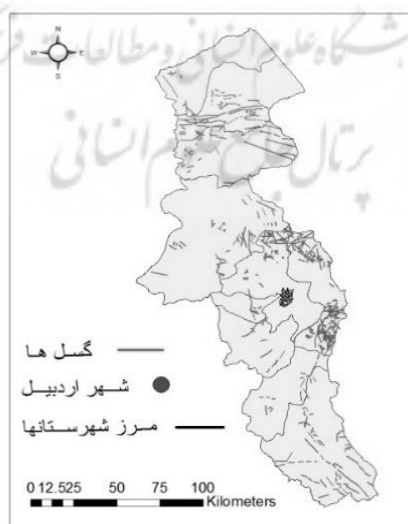
شکل شماره ۲ موقعیت گسل‌های پیرامون شهر اردبیل