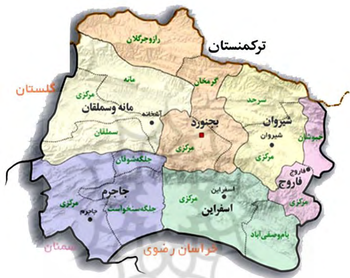
شکل ۳. موقعیت شهر بجنورد

شهر بجنورد در ۲۰° و ۵۷' طول و ۲۹° و ۳۷' عرض جغرافیایی قرار دارد و ارتفاع آن از سطح دریا ۱۰۷۰ متر می‌باشد که از جهت شمال و جنوب غرب با گسل‌ها و از شمال و شرق نیز با مسیل رودخانه‌ها محدود شده است. جمعیت: به استناد نتایج سرشماری سال ۱۳۹۵، جمعیت شهر بجنورد ۲۲۸۹۳۱ نفر می‌باشد (مرکز آمار ایران، ۱۳۹۵).