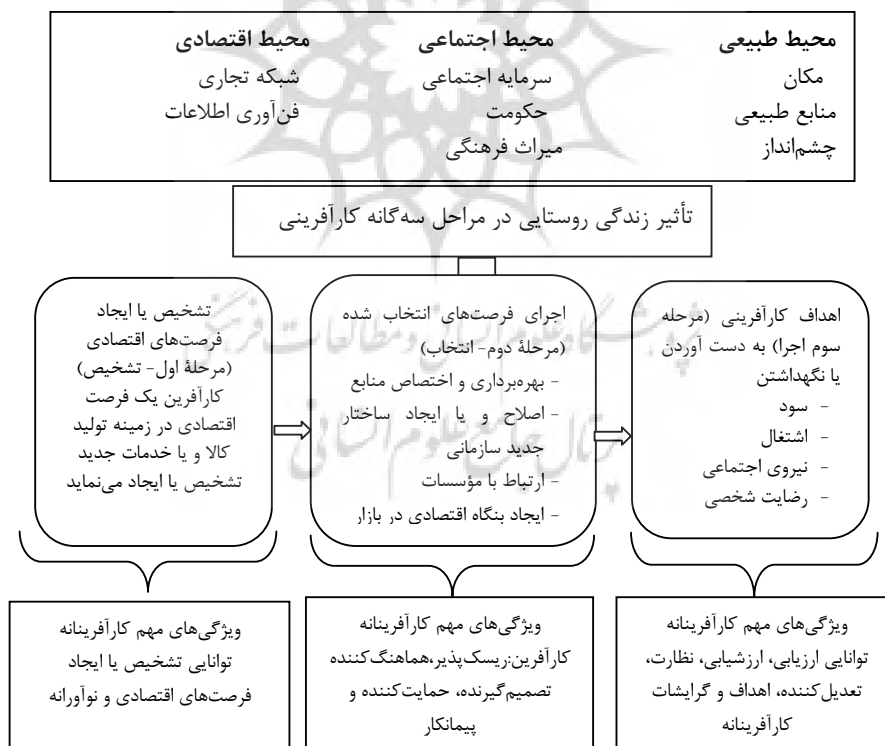
شکل ۱: عوامل ظرفیتی تأثیرگذار در توسعه کارآفرینی محیط‌های روستایی

هزینه‌های هنگفتی به وجود آمده و حفظ شده است؛ به همین دلیل، توجه به این ظرفیت‌ها از دو جنبه دارای اهمیت است: اول اینکه از حداکثر توان خدمت‌دهی ظرفیت‌های موجود باید استفاده کرد؛ دوم اینکه در توسعه‌های درون‌زا، با وجود ظرفیت‌های توسعه در مناطق روستایی، نیاز کمتری به ایجاد زیرساخت‌ها و امکانات تازه خواهد بود. بر این اساس استفاده از ظرفیت‌های محلی برای توسعه به عنوان یکی از اهداف اساسی توسعه محلی در کشورهای مختلف است. یکی از زمینه‌هایی که می‌توان از ظرفیت‌های محلی برای توسعه استفاده کرد، توسعه کارآفرینی می‌باشد. این امر به‌ویژه در مناطق روستایی و کارآفرینی روستایی بسیار مهم و ضروری است.