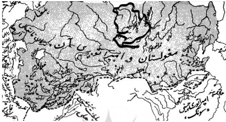
نقشه (۱) قلمرو اویرات در آسیای مرکزی (برگرفته از کتاب امپراتوری صحرانوردان رنه گروسه)

اویرات‌ها همراه قبایل دیگر اغوز از مغولستان به سمت ورای رودخانه ارتیش، ۱ دریای آرال و حاشیه‌های دره سیردریا رهسپار شدند. ۲ (West, 1967:606).