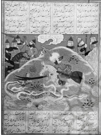
تصویر (ع): نبرد حضرت علی علیه السلام

مصور شده است. قراقویونلوها، سلسله‌ای شیعی بودند و خاوران‌نامه تحت حمایت پیر بوداق پسر جهان‌شاه که در اواخر سده پانزدهم / نهم در شیراز حاکم بود، مصور گشت و احتمالاً مصورسازی این نسخه خطی شیعی، تحت سرپرستی خلیل، پسر اوزون حسن ۱ و توسط همان هنرمندانی که بعد از مرگ پیر بوداق در شیراز باقی ماندند، ادامه یافت. ۲ خاوران‌نامه ، جنگ‌ها و دلاوری‌های حضرت علی علیه السلام را روایت می‌کند و در کنار حوادث تاریخی، جنگ حضرت با اژدها و دیو و جن نیز دیده می‌شود.