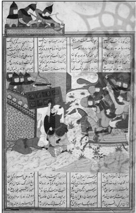
تصویر (۵): خاوران‌نامه، فتح خیبر، دوره ترکمن ۱

در این نگاره، حضرت با پوششی معمولی و بدون شمشیر و زره جنگی ترسیم شده که نمادی از رشادت و بی‌باکی اوست. (تصویر ۵) حضرت با یک‌دست، در قلعه را از جای کنده و در دست گرفته است. نگارگر برای نشان دادن قدرت و توانایی جسمانی و زور بازوی حضرت، شمایل ایشان را فربه‌تر از دیگران ترسیم نموده است. در بخشی از نگاره، بام قلعه در خارج از کادر اصلی قرار داده شده که نشان از نفوذناپذیری قلعه است و اهمیت مبارزه قهرمانانه و پهلوانانه حضرت علی علیه السلام را بیشتر نشان می‌دهد. با این همه، در این نگاره نیز، چهره علی علیه السلام به تصویر درآمده و تنها نماد مذهبی و نشان قداست و روحانیت حضرت، شعله‌های آتش دور سر ایشان است؛ بنابراین، بُعد معنوی و باطنی حضرت به‌طور کامل در شمایل ایشان، تجسم عینی نیافته و بیشتر بر قدرت و توانایی پهلوانانه و قهرمانانه ایشان، به مانند انسانی شجاع و اسطوره‌ای، تأکید شده است و مسئله اصلی در این است که قدرت، شجاعت و روحیه پهلوانی حضرت، پیوند خورده با نیرویی الهی و آسمانی که در گفتمان شیعه بر آن تأکید می‌شود، به تصویر درنیامده است؛ بنابراین، در این نگاره نیز تمهید بصری و نمادگرایی خاصی که نشانگر شخصیت فوق بشری و مقدس گونه حضرت علی علیه السلام باشد، وجود ندارد.