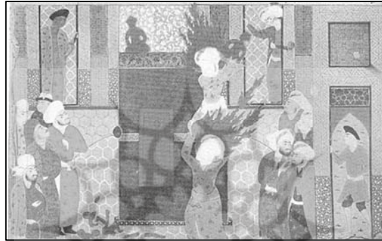
تصویر (۷): علی علیه السلام بر روی شانه‌های پیامبر صلی الله علیه و آله و سلم ، بت‌ها را می‌شکنند، روضه الصفا، دوره صفوی ۱

نموده است. همان طور که از خود حضرت نقل شده که فرمود: «به خدا سوگند در قلعه خیبر را نه به نیروی جسمانی، بلکه با نیروی رحمانی و الهی از جای کندم.» ۱ به هر حال، هر مخاطبی در مواجهه با این نگاره، به شخصیت معنوی و مقدس حضرت و خارق العاده بودن عمل او پی می‌برد. جلوه مهم تصویری دیگری که در رابطه با شمایل حضرت علی علیه السلام جلب توجه می‌کند، تصویرسازی یکسان و یک شکل شمایل حضرت علی علیه السلام و پیامبر صلی الله علیه و آله و سلم است. نگارگر، شمایل هر دو بزرگوار را با شعله‌های آتش یک اندازه، روبند چهره و عمامه یک شکل، لباس با نقش و رنگ یکسان و حتی پیکر یک اندازه به تصویر درآورده است. با این تمهیدات، نگارگر توانسته مقام و منزلت یکسان حضرت علی علیه السلام و پیامبر اسلام را به تصویر درآورد؛ همان طور که شیعیان از پیامبر صلی الله علیه و آله و سلم نقل می‌کنند که فرمود: «علی برای من به منزله هارون است برای موسی، جز اینکه پس از من پیغمبری نخواهد بود». ۲