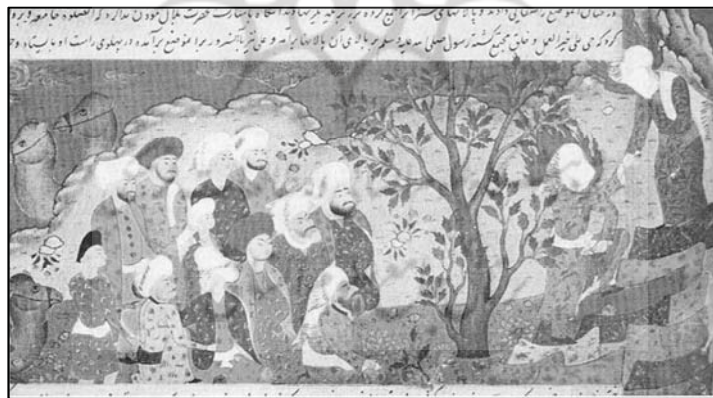
تصویر (۸): غدیر خم، روضه الصفا، دوره صفوی ۱