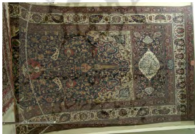
تصویر ۱. نمای کلی قالی پرده‌ای دو رو با نقش محرابی - افشان شاه‌عباسی قنديل‌دار.

قالی «محرابی - افشان شاه‌عباسی قنديل‌دار» به شماره شناسایی ۰۴۱ ردیف ۴۰ و شماره اموالی ۳۴۷ در معرض دید عموم مردم قرار دارد. (تصویر ۱) این دستباف با توجه به کتیبه‌های موجود در ۱۳۲۲ ق. / ۱۹۰۴ م. در شهر مشهد و با همکاری تولیدکنندگان تبریزی، مشهدی و کرمانی در ابعاد ۳۲۱ × ۴۱۰ سانتیمتر بافته شده است. جنس تار و پود آن پنبه و پرز از پشم است. در هر ۶/۵ سانتیمتر ۴۰ گره نامتقارن (فارسی) زده شده، طول ساق‌های گره بین ۳/۵ الی ۵ میلی‌متر است. فرش به شیوه تمام لول بافته شده است و پس از هر رج بافت پود ضخیم و نازک را عبور داده‌اند، شیرازه نیز در وسط و طرفین قالی به صورت متصل بافته شده است. رنگ‌های آن شیمیایی و گیاهی هستند عمده رنگ‌های قالی عبارت‌اند از: لاکی قرمزدانه، سورمه‌ای، آبی، نارنجی، کرم، سبز روشن، آبی تیره، قهوه‌ای روشن، سبز زیتونی، سبزآبی روشن، آبی روشن، بنفش روشن، خاکستری، روناسی و... قسمت‌هایی از فرش دچار صدماتی از قبیل بیدزدگی، ساییدگی، پارگی و دورنگی است که نیاز به مرمت مجدد دارد.