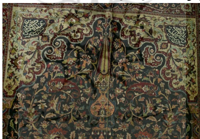
تصویر ۴. طاق محراب همراه با کتیبه‌ها و قندیل.

ج) متن قالی: متن قالی به رنگ سورمه‌ای بافته شده است. طراح با ایجاد دونیم ستون و قرار دادن طاق محراب بر روی آن فضای همچون مدخل ورودی باغ ایرانی یا محراب مساجد ایجاد کرده است. متن اصلی با طرح افشان شاه‌عباسی تزیین شده است. طراح بند ختایی را از دو سمت گل شاه‌عباسی بزرگی که در قسمت پایین قرار گرفته، خارج کرده و در تمامی متن قالی به حرکت درآورده است. این قسمت، همچون حاشیه‌ی اصلی شباهت فراوانی به آثار شاخص عصر صفوی به ویژه فرش افشان شاه‌عباسی گلابتون‌دار موزه‌ی