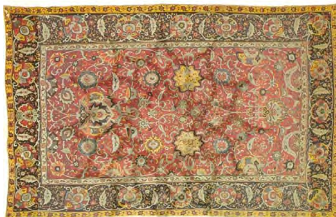
تصویر ۵. قالی افشان شاه‌عباسی گلابتون‌دار با حاشیه‌ی هراتی، اواسط قرن ۱۶ م/۱۰ ق. موزه‌ی فرش آستان قدس رضوی.

فرش آستان قدس رضوی دارد. (تصویر ۵) آرتر آپم پوپ با مطالعه‌ی دقیق فرش‌های ایرانی بیان می‌دارد که طرح‌های افشان شاه‌عباسی در سده‌های ۱۰ و ۱۱ ق/۱۶ و ۱۷، بر سایر طرح‌ها برتری داشته و نگاره‌های مهم آن عبارت‌اند از گل‌های شاه‌عباسی بزرگی که شکل کلی آن یادآور درخت کیهانی است. رنگ زمینه اغلب این فرش‌ها لاک‌سیر است که گاهی به طیف‌های شرابی‌رنگ، سرخ و یاقوتی تغییر می‌یابد و گه‌گاه صورتی‌فام می‌شود، با حاشیه‌ای پهن که در برخی از نمونه‌ها رنگ سبز زمردی سیر و در نمونه‌های دیگر به رنگ سبز متمایل به آبی یا همان آبی هستند. ۱