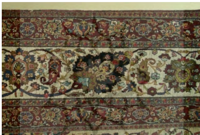
تصویر ۲. حاشیه اصلی و دو حاشیه فرعی با طرح هراتی تزیین شده است.

الف) حاشیه: حاشیه‌ی فرش، دارای هشت نوار تزیینی است. (تصویر ۲) لور یا ساده‌بافی بدون طرح و به رنگ قرمز لاک‌پشته شده است. زنجیره اول به رنگ نارنجی و با عناصر کوچک ختایی تزیین شده است. لازم به ذکر است که فقط همین دو قسمت (زنجیره و ساده‌بافی) دورتادور فرش بافته شده‌اند و سایر نوارهای تزیینی تنها در سه سمت (بالا و سمت چپ و راست قالی) به حرکت درآمده‌اند. حاشیه‌ی فرعی اول و دوم به رنگ لاک‌پشته با گل و برگ ختایی تزیین شده است. زنجیره‌های دوم و سوم به رنگ آبی تیره و به شیوه‌ی واگیره محو کار شده است.