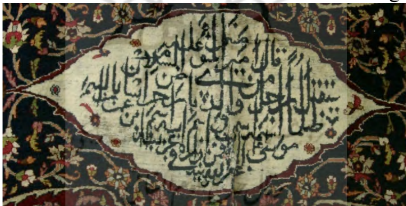
تصویر ۳. کتیبه داخل ترنج پیشانی قالی پرده‌ای دو رو.

۱. پیشانی: این قسمت با حرکت زنجیره چهارم به داخل متن فرش از طاق محراب جدا شده و طراح در فضای مستطیل ایجاد شده طرح لچک و ترنج را اجرا کرده است. لچک‌های این قالیچه به رنگ لاک‌ی و مزین به عناصر ختایی هستند. متن قالیچه سورمه‌ای و با گردش شاخه ختایی تزیین شده است. ترنج آن به رنگ کرم و لوزی شکل است و در آن حدیثی به رنگ تیره و به قلم ثلث آمده است: (تصویر ۳) قال امیرالمؤمنین علیه السلام سیقتل رجل من ولدی بارض خراسان بالسم ظلماً اسمه اسمی و اسم ابیه اسم ابن عمران موسی (ع) الا فمن زاره فی غربه غفر الله ذنبه ۱