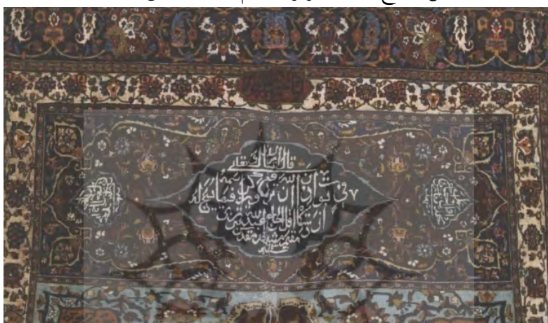
تصویر ۹. کتیبه بافته شده در پیشانی قالی محرابی افشان شاه عباسی قندیل دار.

قال الله تبارک و تعالی فی بیوت اذن الله ترفع و یزکی اسمہ فیها یسیح له ۱ از دستگاه اقل الحاج عبدالله تبریزی مقیم مشهد مقدس سنه ۱۳۲۰