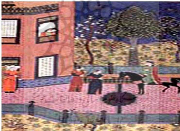
۶. نگاره «گلنار و اردشیر»، منسوب خلیل نقاش مکتب هرات، منبع: پاکباز: ۱۳۸۳: ۹۹