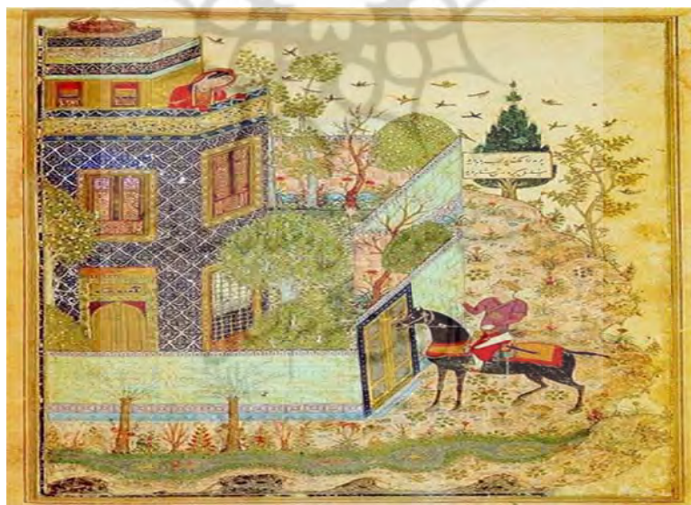
۴. «تجلی فرشتگان بر جوان خوابیده»، منسوب به خواجه عبدالجی، منبع: پلر و بلوم، ۱۳۸۲: ۵۲.