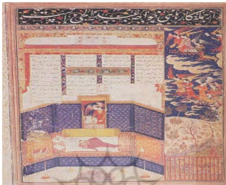
۳. «دیدار همای از همایون»، منسوب به جنید، منبع: گری، ۲۵۳۵: ۹۲.