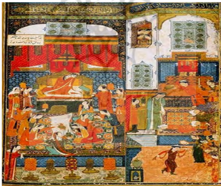
۲. «عروسی همای و همایون»، منسوب به جنید، برگرفته از شایسته‌فر، ۱۳۸۷: ۶