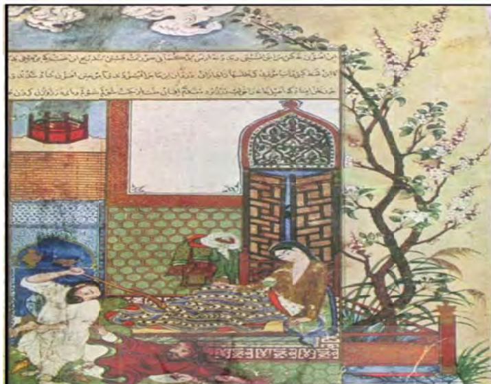
۱. «غافل‌گیر شدن دزد»، منسوب به احمد موسی

۱۴۲ هنر نگارگری و نقاشی دوره آل جلایر و تأثیر آن بر شکل‌گیری مکتب نگارگری هرات دوره تیموریان