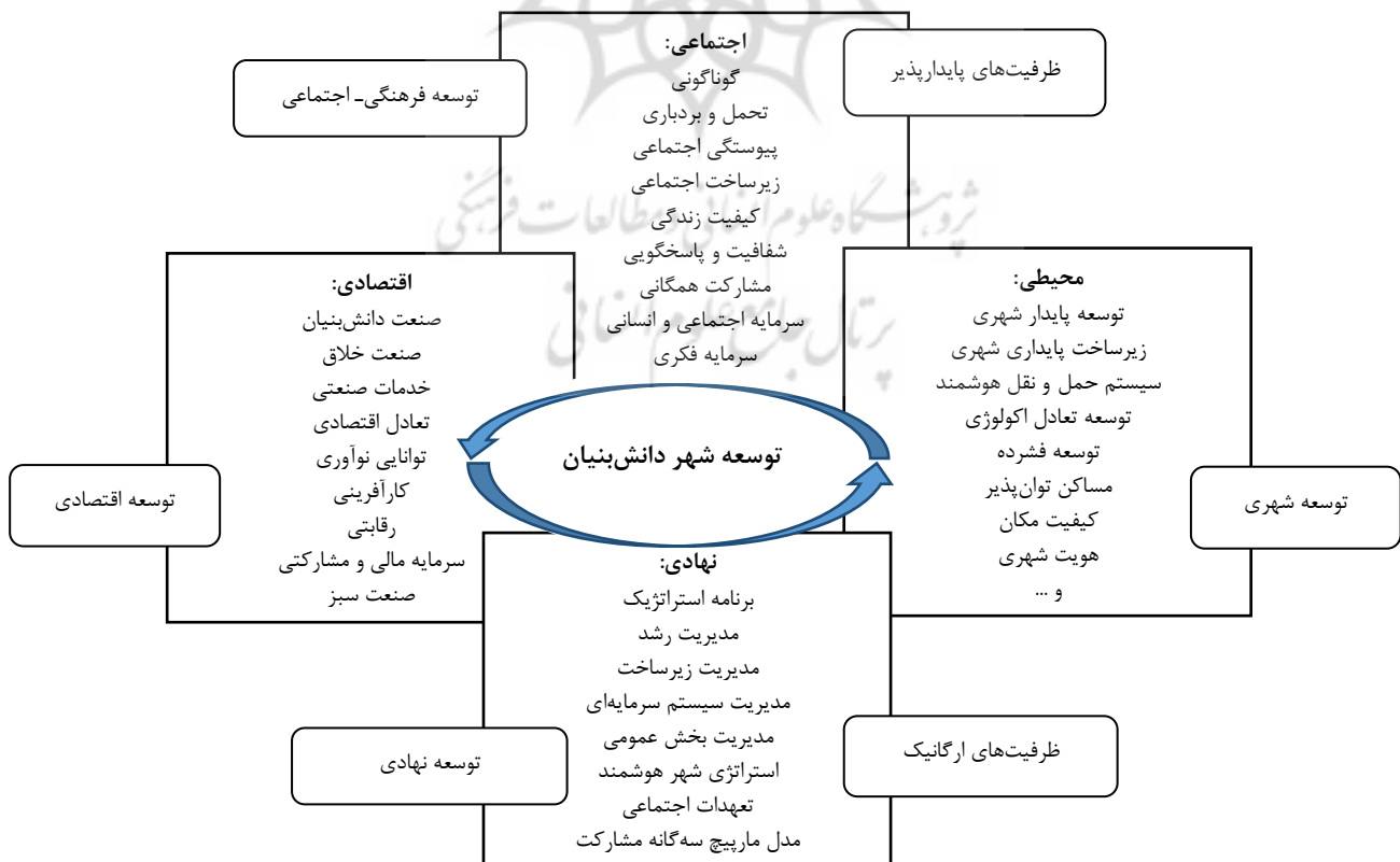
شکل ۱- توسعه قلمروی شهر دانش‌بنیان (KBUD) ۱