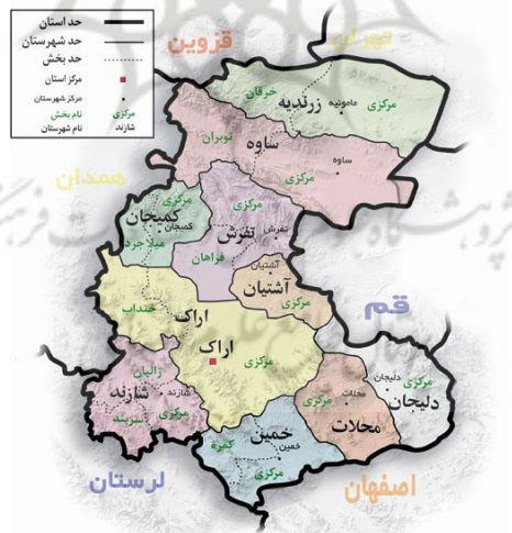
نقشه ۱- موقعیت محدوده مورد مطالعه

شهر اراک در مختصات جغرافیایی ۴۹ درجه و ۴۲ دقیقه طول جغرافیایی، ۳۴ درجه و ۵ دقیقه عرض جغرافیایی، در فلات مرکزی ایران قرار گرفته است و ارتفاع متوسط آن، ۱۷۵۵ متر از سطح دریا می‌باشد. از نظر طبیعی، فلات فعلی اراک به وسعت ۵۴۰۰ کیلومترمربع است که ۲۴۰۰ کیلومتر آن را جلگه مرتفع اراک و مابقی را ارتفاعات اطراف اراک تشکیل می‌دهد. نقشه ۱ محدوده مورد مطالعه را نشان می‌دهد.