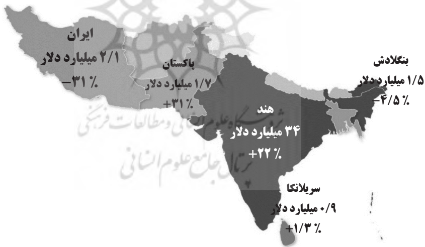
شکل ۲: جریان ورودی FDI برای ۵ کشور میزبان منتخب در سال ۲۰۱۴

دلار، و تانزانیا نیز ۱/۲ میلیارد دلار سرمایه‌گذاری خارجی جذب کرده‌اند که بیش‌تر از ایران بوده است. آمار ارائه‌شده از سوی آنکتاد (۲۰۱۵) نشان می‌دهد ایران از نظر جذب سرمایه‌گذاری مستقیم خارجی در سال ۲۰۱۴، میان ۱۴ کشور غرب آسیا رتبه ۶ را به خود اختصاص داده است. رتبه ایران در سال ۲۰۱۲ در آسیا ۳ اعلام‌شده بود. در این منطقه، ترکیه با جذب ۱۲ میلیارد دلار سرمایه‌گذاری مستقیم خارجی، رتبه نخست را به خود اختصاص داده است و امارات با جذب ۱۰ میلیارد دلار در رتبه دوم قرار گرفته است. میزان سرمایه‌گذاری مستقیم خارجی جذب‌شده توسط کشورهای دیگر منطقه عبارت است از: بحرین ۹۵۷ میلیون دلار، عراق ۷/۴ میلیارد دلار، اردن ۷/۱ میلیارد دلار، کویت ۴۸۶ میلیون دلار، لبنان ۲ میلیارد دلار، عمان ۹/۱ میلیارد دلار، قطر ۱۰ میلیارد دلار، عربستان ۸ میلیارد دلار، فلسطین ۱۲۴ میلیون دلار و یمن ۵۷۸ میلیون دلار.