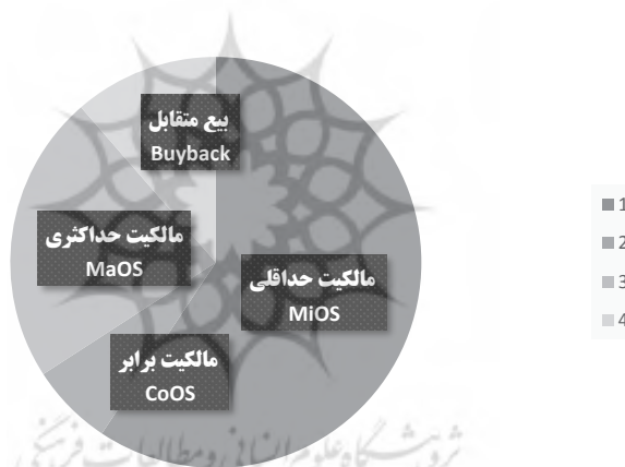
شکل ۳: نمودار دایره‌ای روش‌های ورود شرکت‌های چندملیتی خارجی در ایران

راهبرد و روش‌های ورود شرکت‌های سرمایه‌گذار خارجی در ایران به تفکیک نحوه مالکیت و مناطق جغرافیایی شرکت مادر در جدول (۳) آمده است. بیش‌ترین نوع مالکیت و روش استفاده توسط سرمایه‌گذاران مربوط به مالکیت حداقلی است که ۵۹ درصد از شرکت‌های خارجی سهم پایین‌تر از ۵۰٪ را در مالکیت و کنترل شرکت وابسته خارجی مستقر در ایران دارند. تنها ۲۳ درصد از شرکت‌های تابعه خارجی در ایران دارای مالکیت حداکثری شرکت مادر سرمایه‌گذارند. سهم بیع متقابل نیز از کل مجموع ۱۲۳ پروژه و شرکت خارجی ۱۱ درصد است که این نوع سرمایه‌گذاری بیش‌تر در بخش نفت و گاز و معادن صورت پذیرفته است.