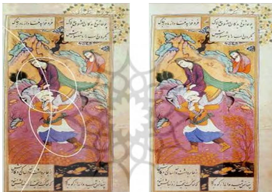
تصویر ۸ ب- نمایش دوایر و حرکت‌های خمیده در رابطه با جایگیری، عناصر تشکیل دهنده اثر.

در تصویر ۸ ب- در این نگاره پیکره فرهاد، اسب و شیرین در وسط قاب می‌باشد. کمتر از ترکیب‌بندی هندسی استفاده شده است و در تقارن موجود در ترکیب‌بندی و نوع حالت و فیگوراتیو پیکرها از ترکیب مثلثی که نشان ثبات و پایداری و قدرت و جوانمردیست استفاده شده است.