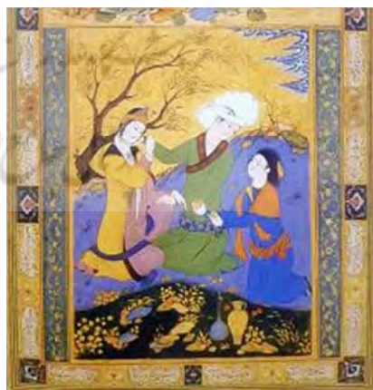
تصویر ۶ الف- عشاق در صحرا، اثر رضا عباسی، آبرنگ روی کاغذ، ۱۰۱۸ ه.ق. مأخذ: کنبی: ۱۳۸۹، ۹۰