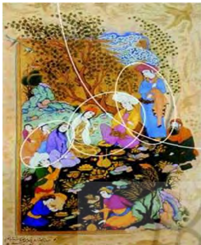
تصویر ۷ ب- نمایش دایره و حرکت‌های خمیده در رابطه با جای‌گیری، عناصر تشکیل دهنده اثر مأخذ: نگارندگان.