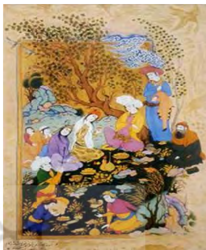
تصویر ۷ الف- گلگشت با اشراف‌زاده، اثر رضا عباسی، آبرنگ روی کاغذ، ۱۰۲۰ ه.ق.