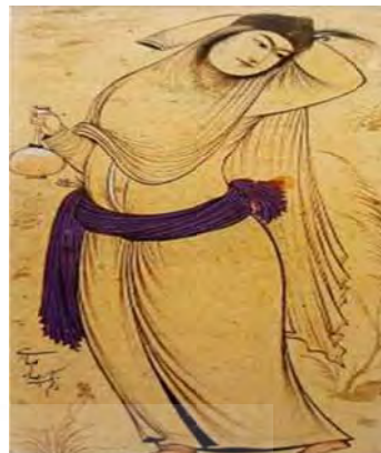
تصویر ۵ الف- زنی با قرابه و دست بالا برده، اثر رضا عباسی، طراحی رنگی روی کاغذ، ۱۰۲۹-۱۰۳۲ ه.ق مأخذ: کنبی: ۱۳۸۹، ۱۳۷