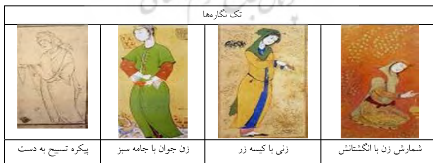
جدول شماره ۲: نمونه‌هایی از تصاویر زنان در آثار رضا عباسی

زنان در آثار وی حضوری پررنگ دارند. اغلب این زنان جوانانی هستند که در فضایی بدون زمان و مکان خاص در رویایی خویش فرورفته‌اند. زنانی که در قابی مستقل تصویر گشته و نشانی از وضعیت زنان عصر خود را در نحوه پوشش، رنگ، زیورآلات و ... دارند. با توجه با گرایش واقع‌گرایانه رضا، این نگاره‌ها، می‌توانند به عنوان زبان گویای عصر خود تلقی گردند (جدول شماره ۲).