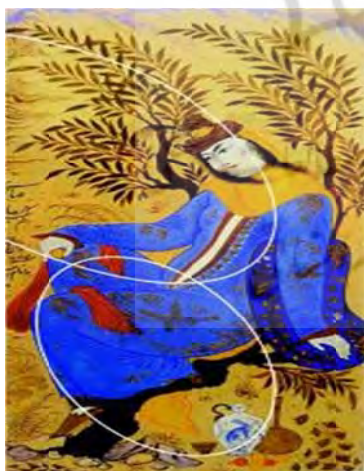
تصویر ۲ ب- نمایش دواير و حرکت- های خمیده در رابطه با جای گیری، عناصر تشکیل دهنده اثر

در تصویر ۲ ب- در این نگاره از ترکیب دو نیم دایره در ترکیب بندی و فرم استفاده گردیده است و در این ترکیب، فرم اصلی تقریباً حالت تقارن داشته و قرارگیری پیکره در مرکز این دو نیم دایره ایجاد حس پایداری و در عین حال سبکی را تداعی می‌کند.