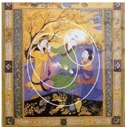
تصویر ۶ ب- نمایش دایره و حرکت‌های خمیده در رابطه با جایگیری، عناصر تشکیل دهنده اثر مأخذ: نگارندگان

ندیمه این شاهزادگان می‌باشد. در این اثر ظرافت و زیبایی بسیار ماهرانه‌ای را مشاهده می‌کنیم و هم‌چنین چند نکته که می‌توان به لحاظ موضوعی به آن‌ها اشاره کرد: یک این که بر خلاف اثرهایی که از عاشق و معشوق از رضا دیده‌ایم در این تصویر پیکره یک مرد و دو زن را مشاهده می‌کنیم. در تحلیل موضوعی، مرد در حال نوازش چانه و پای معشوق خود است ولی نگاهش به او نیست و نگاه مرد به پیش خدمت و حضور آن معطوف شده در حالیکه در تصاویری که از خلوت انس عاشقانه مرسوم است اغلب عاشق و معشوق را تنها می‌بینیم. هم‌چنین در این اثر به پس زمینه نیز تأکید بیشتری شده و با دقت و ظرافتی هم‌چون پیکره‌ها اجرا و کار شده است. در این اثر نیز کوزه‌ها بیشتر عنصری فرمالیته داشته که در ترکیب‌بندی قاب بیشتر استفاده شده است و هم‌چنین ابرهای باد خورده که شاخ و برگ درختان نیز آن را همراهی می‌کند به نوعی در زنده‌تر کردن فضا نقش مؤثرتری دارد. در تصویر ۶ ب- در این نگاره بر خلاف تک نگاره‌ها از ترکیب سه نگاره و پیکره در کادر استفاده شده است و مثل دیگر آثار رضا عباسی در این اثر نیز از ترکیب‌بندی و فرم هندسی و دایره‌ای استفاده نموده و ترکیب نشستن انسجام در ترکیب‌بندی را ایجاد نموده است و در چرخه نیم دایره‌ای نگاه‌ها، در امتداد همین انسجام پیکره‌ها به نوعی تعادل و حرکت را برقرار کرده است.