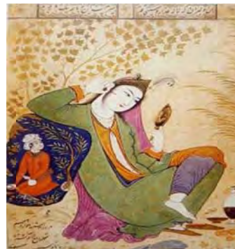
تصویر ۳ ب- نمایش دواير و حرکت‌های خمیده در رابطه با جای‌گیری، عناصر تشکیل دهنده اثر مأخذ: نگارندگان.