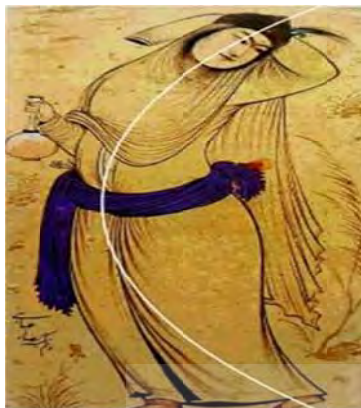
تصویر ۵ ب- نمایش دواير و حرکت‌های خمیده در رابطه با جای‌گیری، عناصر تشکیل دهنده اثر مأخذ: نگارندگان.