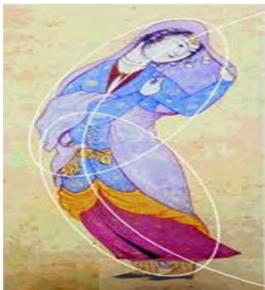
تصویر ۱ ب- نمایش دوایر و حرکت‌های خمیده در رابطه با جای‌گیری، عناصر تشکیل دهنده اثر مأخذ: نگارندگان.