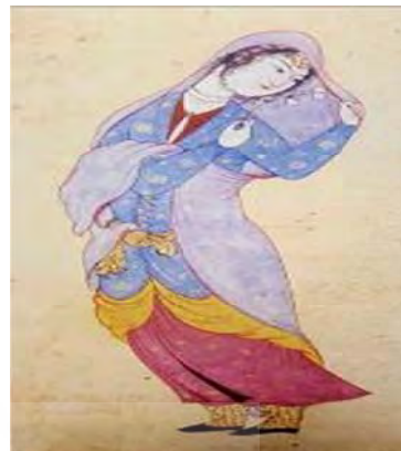
تصویر ۱ الف- زنی با حجاب چادر، اثر رضا عباسی، آبرنگ روی کاغذ، حدود ۱۰۰۸ ه.ق