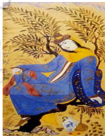
تصویر ۲ الف- زن نشسته در زیر درخت، اثر رضا عباسی، آبرنگ روی کاغذ، ۱۰۲۵ ه.ق