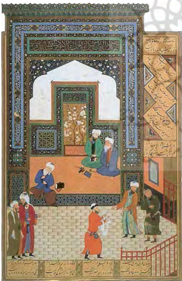
تصویر ۱. نگاره "مجادله‌ای در حضور قاضی" اثر کمال‌الدین بهزاد، براساس حکایتی از بوستان سعدی.

از مشهورترین و بانفوذترین نقاشان دربار سلطان حسین، و نابغه هنر نگارگری ایران و مکتب هرات کمال‌الدین بهزاد هراتی است. بهزاد در عمر تقریبی ۷۵ ساله (درگذشت ۹۴۱-۹۴۲ ه.ق) خود شاگردان بسیاری را که به شیوه وی کار می‌کردند تربیت کرد به احتمال زیاد حدود سال ۸۷۴ ه.ق. آغاز به فعالیت کرده و آثار معتبر وی متعلق به سال‌های ۸۸۴-۸۹۵ ه.ق. است (کنبی، ۱۳۹۱: ۷۶). نوآوری‌های بهزاد علاوه بر حوزه پردازش و تکنیک، در حوزه موضوع هم بوده است. استفاده از رنگ‌ها به‌عنوان عنصر مهم بیانی، یکسان‌سازی ابعاد، شخصیت‌پردازی و انسان‌محوری در موضوعات روزمره که قبلاً کسی به آنها نپرداخته بوده، از جمله این ابداعاتند (شیرازی، ۱۳۸۵: ۲۲-۱۹). لذا دستاورد بهزاد برای سنت نقاشی ایرانی ارایه بُعد دنیوی و این جهانی در تصویرگری نسخه‌های خطی از طریق نمایش چهره‌هایی با حالات و ویژگی‌های متفاوت همچون: در حین سخن گفتن یا تکان دادن سر و دست بوده است. همان جزئیات تصویری که از مقتضیات روایتگرانه اکید متن فراتر