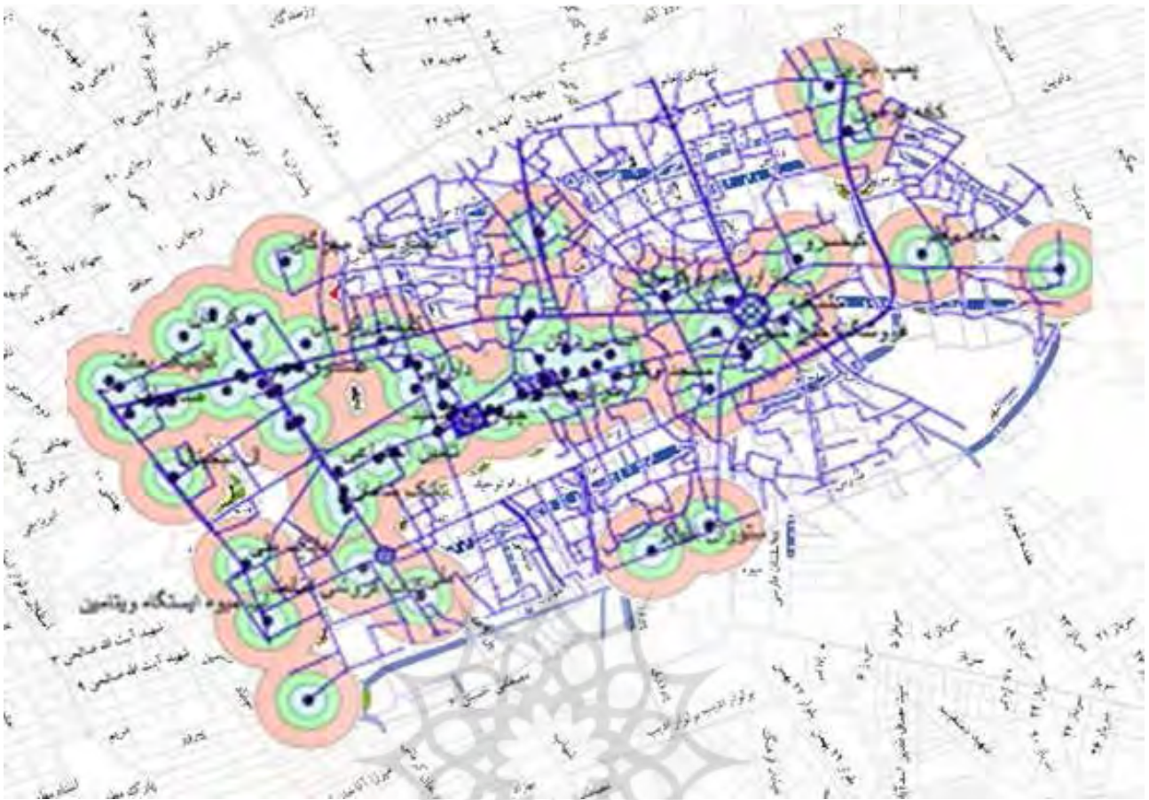
تصویر ۴. نقشه تحلیل ارزش‌های مکانی مرتبط با کاربری زمین.