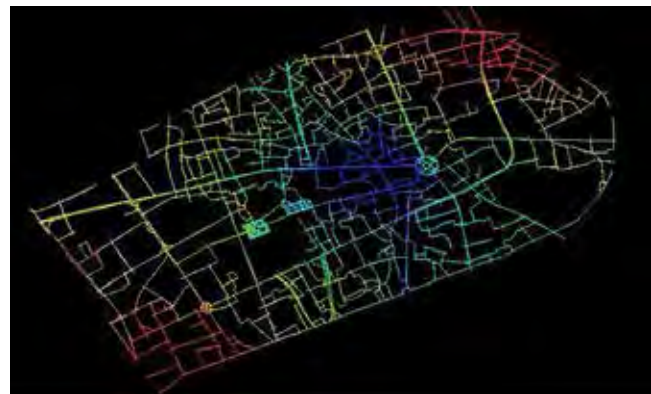
تصویر ۳. نقشه‌های تحلیل a. عمق محوری، b. آنتروپی محوری.