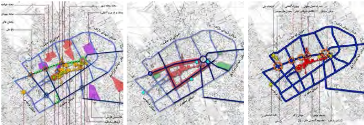
تصویر ۲. نقشه‌های ساختار ذهنی مردم از بافت تاریخی در سه بعد کالبدی، عملکردی و معنایی. مأخذ: نگارندگان.