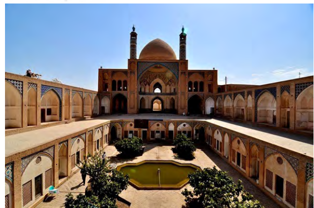
تصویر ۲. مسجد آقا بزرگ کاشان.