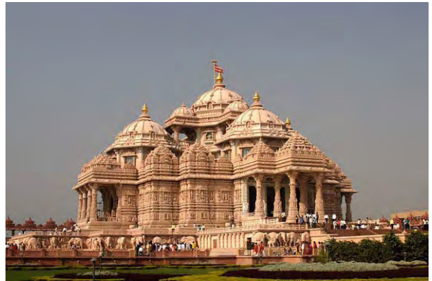
تصویر ۴. معبد آشکاردام هند.

به این ترتیب بررسی سلیقه از مشاهده یک بنا به دو مقوله کلی رسید. اول اینکه انتخاب براساس ادراک حسی یا دریافت معنا از منظر فرم یا آنچه به لحاظ بصری یا عینی دیده شده انجام شود، دوم آنکه مفاهیم و معانی بعد از دیدن بنا از مرتبه ظاهر فراتر رود و با توجه به ذهنیات فرد شکل بگیرد که آنگاه با توجه به زمینه‌های ذهنی افراد با هم به دریافت‌های متفاوتی خواهد رسید. اما بدیهی است در مقابل نمای یک بنا یا برون معماری، ما نظاره‌گر هستیم و در درون آن ساکن. ظاهر بنا به شهر تعلق دارد و موجودیتی صلب و ایستاست، در حالیکه درون، فضایی است پویا و زنده که بیش از آنکه دیده شود، احساس می‌شود. بنابراین سکونت یا زندگی و فعالیت در درون، بنا وجه دیگری از معماری است که افزون بر حس دیداری، با حس‌های دیگر انسان عجین‌تر است. پس در جستجوی مبادی سلیقه در معماری، به کیفیت سکونت در بنا پرداخته خواهد شد.