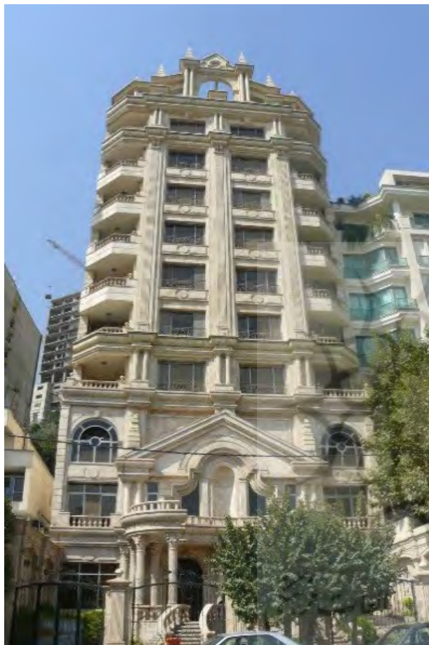
تصویر ۵. مجتمع مسکونی در خیابان نیاوران تهران، نمونه‌ای از طراحی موسوم به کلاسیک. مأخذ: نگارندگان.

شکل می‌دهند و دسته دیگر که تمایلی در پیوند خود از طریق سلیقه به مد را در دستور کار ندارند، بنابراین نسبت سلیقه و مد در معماری به میزان تمایل افراد در تعلق یافتن به لایه‌های اجتماعی و کسب تمایز و تشخیص فردی، بستگی دارد (تصویر ۵ و ۶).