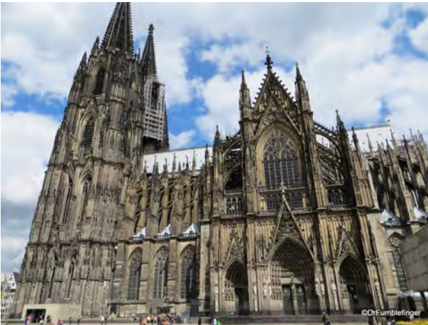
تصویر ۳. کلیسای جامع کلن آلمان.