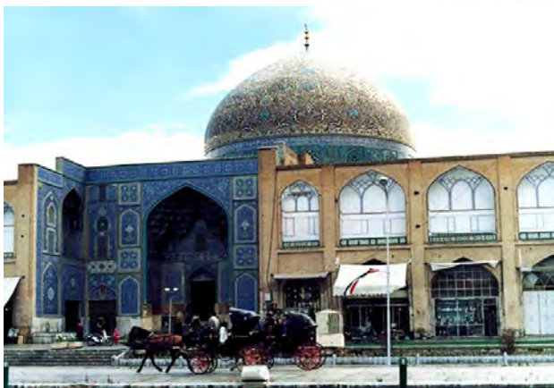
تصویر ۱. مسجد شیخ لطف‌الله اصفهان.

آثار هنری و معماری راه یافت، موجب پیوند عمیقی میان این عرصه‌ها شد. چنانکه یوهانی پالاسما باور دارد «معماری هنر سازگاری میان ما و جهان است و این ژرف‌اندیشی از طریق حس اتفاق می‌افتد؛ به نظر وی نخستین مرتبه این رخداد به طور معمول بصری است و حس‌های دیگر مانند لامسه و بویایی نیز در مراتب بعدی فعال می‌شوند و به آن اضافه می‌گردند» (Pallasmaa, 1994). بنابراین نخستین جستجوها در مورد نسبت معماری و سلیقه، به‌سان یک فصل مشترک، به وادی حس و زیباشناسی معطوف است. اما چگونه؟ توجه اهل نظر در مورد حس زیباشناختی، به دو امر معطوف می‌شود: نخست آنکه اگر چه تجربه زیباشناختی با حواس آغاز می‌شود اما با آن پایان نمی‌پذیرد؛ زیرا دیدن رنگ‌ها، شکل‌ها، فضاها در آثار هنری و معماری با تیرگی و روشنی، نرمی و زبری، دوری و نزدیکی فاصله صحنه‌ها و رویدادها همراه است که طی فرایند ادراک حسی به تولید معنا می‌انجامد. دوم اینکه ادراک حسی و زیباشناختی ادراک جنبه‌های معینی از متعلق ادراک است و لازم نیست محدود به آثار هنری و معماری یا مصنوعات انسان باشد؛ پدیدارهای طبیعی، چهره انسان، اصوات، طلوع و غروب آفتاب و هر پدیده‌ای در هستی می‌تواند به‌سان متعلق ادراک، برای انسان وجه حسی داشته باشد (اسکروتن، ۱۳۹۳: ۱۸-۱۷). نکته مهم، تفاوت میان پیدایش حس خوشایندی که به واسطه خود اثر یا حس خاص مسحور کننده‌ای است که از طریق آن در ما به وجود می‌آید. مانند شنیدن یک قطعه موسیقی یا دیدن صحنه‌ای از تئاتر یا شنیدن یک شعر. شعر یا موسیقی مسحور کننده است اما وجه ملموس مادی ندارد. اینجا تنها حس شنوایی است که به سبب آن شخص دچار جذب یا وجد می‌شود. بنابراین در مقوله زیباشناختی و حسی که پس از آن به وجود می‌آید دو نکته مستتر است، یکی در باب لذت