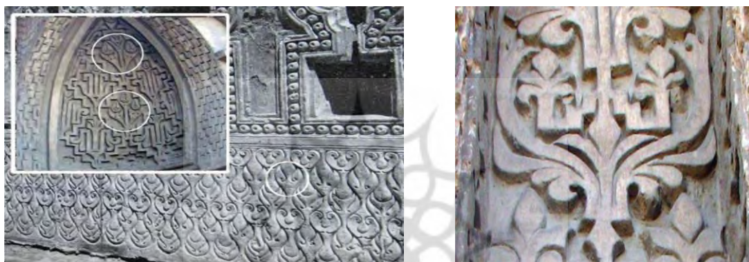
تصویر ۸: نقش بال برگرفته از تزئینات ساسانی در گچبری مسجد جورجیر اصفهان (احمدی و شکفته، ۱۳۹۰: ۱۴۴)