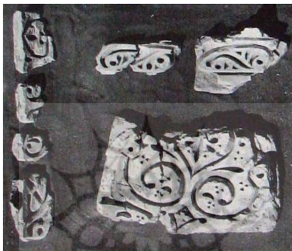
تصویر ۱۳. قطعات گچبری تپه مدرسه نیشابور متأثراً از سبک ج سامرا (Wilkinson, 1986: 127)

شهر تاریخی نیشابور به عنوان یکی از مراکز مهم قرون اولیه اسلامی مدتی پایتخت طاهریان بوده و در زمان سامانیان مهم ترین مرکز هنر به شمار می رفته است. این شهر دارای تپه های تاریخی متعددی است که در حفاری های باستان شناختی چهار مورد از آن ها یعنی تپه مدرسه، تپه تاکستان، تپه سبزپوشان و قنات تپه، قطعات زیبای گچبری یافت شده است. کامل ترین قسمت های گچبری در قسمتی به نام ابنیه سبزپوشان است که شامل مقرنس های دیواری است و در قسمت جنوب غربی صحن حیاط و تالار گنبددار مجاور آن قرار دارد. کامل کننده این نوع گچبری ها، رنگ هایی است که بر روی آن ها نقش بسته است که شامل رنگ های سفید، زرد، آبی و قرمز است و به صورت طرح های زیبای طوماری و برگ نخلی است که بعضی از آن ها درون شکل های چهارگوش یا شش گوش، مانند اشکال تزئینات سامرا قرار دارد (انصاری، ۱۳۶۶: ۳۵۹). (تصاویر ۱۳).