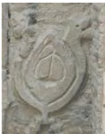
تصویر ۷: نقش پرنده در گچبری سردر مسجد جورجیر اصفهان (علیان و دیگران، ۱۳۹۱: ۸)