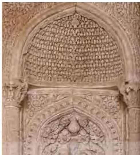
تصویر ۴. محراب گچبری شده مسجد جامع نایین (اعظمی و دیگران، ۱۳۹۲: ۲۰)

برگ کنگره‌های استلیزه تشکیل شده که اکثراً با نقوش گچبری زمان ساسانی و در دوران اسلامی با نقوش گچبری مسجد سامرا قابل مقایسه است. نقش هشت و چلیپا در این تزیینات جز اولین تزیینات هندسی به این شکل است (احمدی و شکفته، ۱۳۹۰: ۱۳۹-۱۴۰).