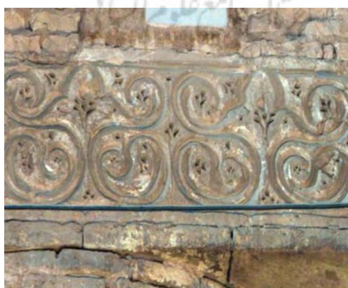
تصویر ۵. گچبری مسجد جامع اصفهان متأثر از گچبری سبک ج سامرا (احمدی و شکفته، ۱۳۹۰: ۱۳۷)

بنای اولیه مسجد جامع اصفهان بر طبق متون تاریخی و تأیید بررسی های باستان شناختی، مربوط به قرن دوم هجری است. این بنا پس از دو قرن توسط آل بویه بازسازی شده و از اطراف صحن گسترش یافت. در دوران بعد نیز قسمت هایی به این مسجد افزوده شده است. در سال های ۱۳۵۱-۱۳۵۷ شمسی، بقایای این مسجد کهن در حفاریات باستان شناسی زیر بخش های فعلی مسجد از جمله در زیر گنبد خانه ی نظام الملک و شبستان های سلجوقی به دست آمد. در طی این حفاری ها، دیوار قبله ی اولیه غنی از گچبری قالبی مشاهده شد که اثر گچبری ها به روی فرورفتگی های محراب نیز دیده می شود. هیئت حفاری این گچبری ها را متعلق به قرون دوم هجری می دانند. گچبری هایی نیز بر روی دیواره ی مقصوره از زیر اندود گچی یافت شده است که مشابه تزیینات سبک سامرا (قرن نهم میلادی / تصویر ۵) هستند (احمدی و شکفته، ۱۳۹۰: ۱۳۶).