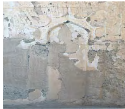
تصویر ۱۶. طرح تزئینی پلکانی محراب مسجد جامع نایین (انیسی، ۱۳۸۹: ۱۹)