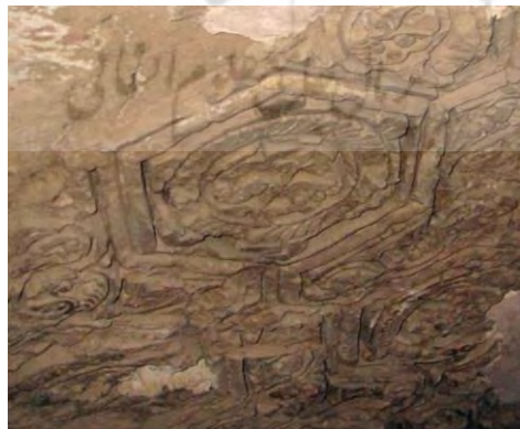
تصویر ۱۲. نقش هندسی در تزئینات گچبری مسجد جامع نطنز - قرن ۴ هجری (احمدی و شکفته، ۱۳۹۰: ۱۴۵)

مسجد جامع نطنز شکلی چهار ایوانی دارد و شبستان آن با طرح هشت ضلعی ساخته شده که یکی از قدیمی ترین طرح ها در معماری اسلامی است. در ایوان های چهارگانه مسجد کتیبه های متعدد وجود دارد. ایوان شمالی علاوه بر تزئینات فوق العاده دارای کتیبه ای به خط ثلث بر زمینه ای آبی است که آیاتی از سوره جمعه و آیه ۱۱۴ سوره هود را نشان می دهد. بر کتیبه ی گچبری شده هلال داخل ایوان شمالی نیز آیه های ۱۸ و ۱۹ سوره توبه دیده می شود. ایوان جنوبی مسجد نیز با گچبری و مقرنس کاری تزئین شده است. (تصویر ۱۲/ کیانی، ۱۳۸۳: ۱۷۵-۱۷۶).