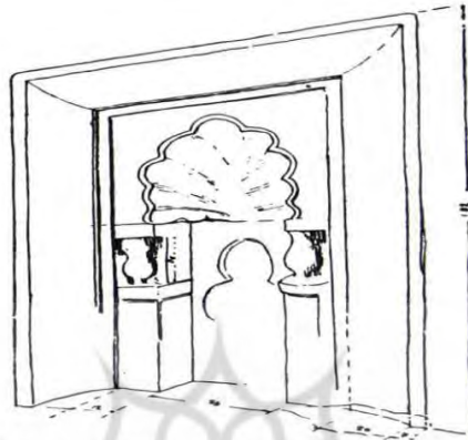
تصویر ۱۱. طاقنمای صدفی نه پر در محراب مسجد شاهپور آباد (احمدی و شکفته، ۱۳۹۰: ۱۳۴)

مسجد شاهپور آباد در شمال شهر اصفهان واقع گردیده است و تاریخ این بنا را بین قرن دوم تا اواخر قرن سوم هجری می دانند. این بنا محراب قدیمی داشته که کل نمای محراب گچ اندود با فرورفتگی صدفی بوده است. نمونه های دیگر شبیه به آن را می توان در مسجد جامع قروه بافت. طبق نظر محققان، این تزئین صدفی شکل برای اولین بار در سوریه دیده شده است. همچنین طاقچه صدفی شکل در دوره ی اسلامی به صورت زیبایی در مسجد الاقصی در بیت المقدس ظاهر شده که متعلق به اواخر قرن اول هجری است. محراب مسجد شاهپور آباد یک شکل تکامل نیافته از این نوع محراب هاست که متعلق به دوران اولیه ورود اسلام به ایران است. (احمدی و شکفته، ۱۳۹۰: ۱۳۳-۱۳۴). (تصویر ۱۱).