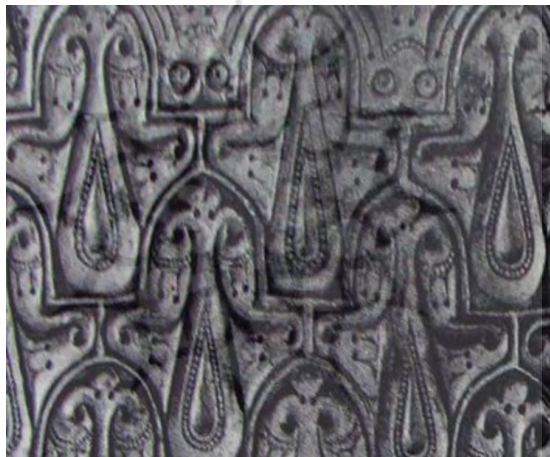
تصویر ۶. گچبری سامرا سبک ج (هیلن براند، ۱۳۸۵: ۴۰۳)

سبک ج: این سبک دارای تکنیک جدیدتر و قالب بندی شده است که با طرح های مختلفی اجرا شده است و طرح ها برجستگی کمی دارند، کناره های طرح به طور مورب با سطح برخورد کرده (پخ کاری شده) و تقریباً محو شده اند که گاهی به نام کنده کاری پشت ماهی شناخته می شود. در این نوع جزئیات به علت عمق کم تحت تأثیر نور و سایه نبوده و حالت تزئینی طرح به سادگی ارایه شده است. ویژگی دیگر این سبک تفران در محور عمودی است (اتینگهاوزن و گرابر، ۱۳۸۱: ۱۰۸-۱۱۲/ هیلن براند، ۱۳۸۵: ۳۹۸). (تصویر ۶).