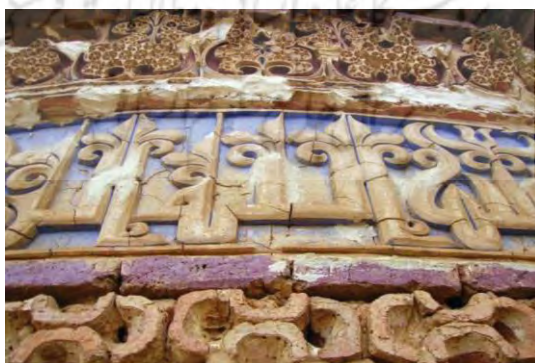
تصویر ۱۵. نقش برگچه های سه لپی در کتیبه گچبری برج رسگت (احمدی و شکفته، ۱۳۹۰: ۱۴۱)

برج رسگت برج آجری زیبایی است که لبه ی برج با ردیف مضاعفی از مقرنس های آجری مزین به نقوش گچبری تزئین شده است. در پایین این مقرنس ها، کتیبه ای با شکوه به خط کوفی گچبری شده و حروف کتیبه به رنگ سفید بر زمینه ی آبی جلوه می کند. بالای در ورودی، کتیبه دیگری که آن هم از گچ ساخته شده وجود دارد. این کتیبه شامل ۴ سطر است که سه سطر اول و نیمی از سطر چهارم به خط کوفی است و در انتها متنی به خط پهلوی نوشته شده است. گچبری های برج به لحاظ تقارن و تکرار نقش، استمرار هنر گچبری دوره ساسانی است، مانند گچبری های شهر تاریخی نیشابور و مسجد جامع ناپین که تکرار نقش و تقارن از ویژگی های آن ها است (احمدی و شکفته، ۱۳۹۰: ۱۴۱). (تصویر ۱۵).