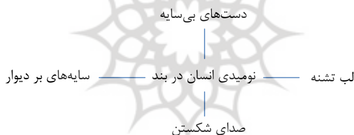
شکل ۳- معنابن دوم

معنابن دوم، تصویر نومیدی انسان‌های دربندی است که نشانه‌های نشان‌دار «دست‌های بی‌سایه»، «سایه‌های بر دیوار»، «صدای شکستن صدای آدمی» و «لب تشنه»، فضای زندان و این انسان‌ها را ترسیم می‌کند.