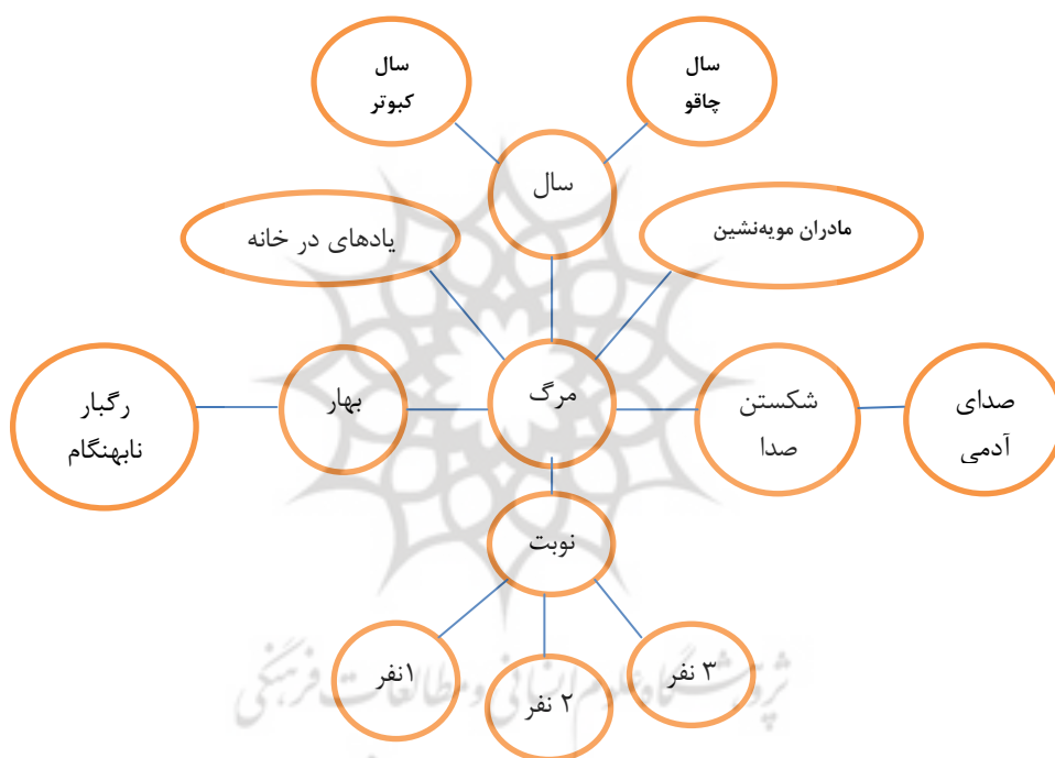
شکل ۴- هسته و اقمار منظومه توصیفی

متفاوت معنایی سوق می‌دهد و خواننده با خوانش غیر مستقیم به هسته مرکزی شعر دست می‌یابد. قمرهای این منظومه، مسیر نوبت را نشان می‌دهد و نوبت از «سه» به «دو» و سپس به «یک» می‌انجامد. «شکستن صدا؛ صدایی شبیه آدمی»، روایت «مادرانی که به مویه نشسته‌اند»، «بهار که رگبار آن، نابهنگام» است و «سالی» که «سال کبوتر و چاقو» است و «یادهای در خانه»، اقماری هستند که مسیر مرگ را آشکارا از «سه نفر» به «یک نفر» نشان می‌دهد و شعر را به انجامی - که مخاطب پایان آن را رقم می‌زند - می‌رساند.