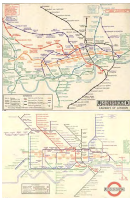
تصویر ۴. تصویر بالا نقشه متروی لندن براساس واقعیت خطوط مترو. تصویر پایین بازنمایی گرافیکی آن به منظور ادراک بهتر. هدف: مسیریابی آسان. مأخذ: wobblingsolutions.wordpress.com .

واقعی یا گرافیکی از فرآیند شکل‌گیری یک موضوع یا یک روش آموزشی است. (تصویر ۵) جزوه‌ها، کتب، لوح‌های آموزشی و بازنمایی‌های روایت‌گونه دنباله‌دار نیز در این بخش تقسیم‌بندی می‌شود. هدف این بازنمایی ادراک بهتر جزئیات یک خبر، حادثه، رویداد یا داستان است. بازنمایی روایی دربرگیرنده تصاویری است که معمولاً یک خط آغاز و پایان دارد. این گونه تصاویر ممکن است بازنمایی یک خبر، حادثه یا سلسله مراتب وقوع یک حادثه باشد که به جهت ادراک با چند گام تصویری بیان می‌شود. تصویرسازی‌های کودکان که داستان‌های آموزشی و اخلاقی را بازآفرینی می‌کنند در این دسته قرار می‌گیرند.