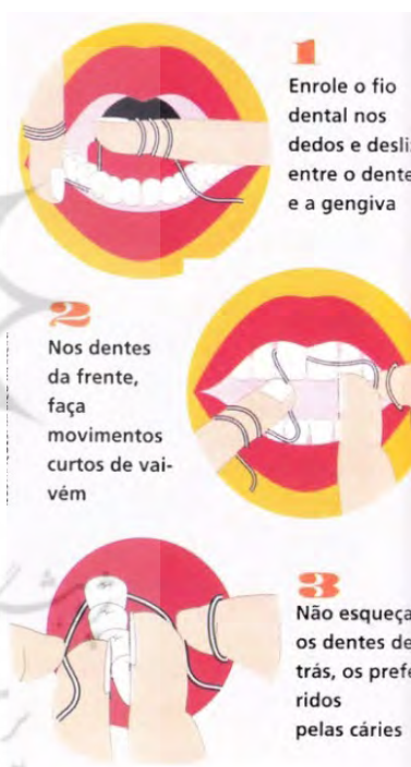
تصویر ۵. بازنمایی ساده و گرافیکی چگونگی استفاده از نخ دندان. هدف آموزش.

گونه‌ای دیگر بازنمایی در گرافیک اطلاع‌رسان، بازنمایی با تلخیص یا ساده‌سازی است؛ مانند اصلاح گرافیکی تصویر یک نقشه و کاربردی کردن آن به جهت تشخیص بهتر مسیرها (تصویر ۵). بازنمایی تصویر گفته شده با بازآفرینی توأم است. در پیشینه به نقل از «پهلوان» گفته شد که در آثار گرافیک با دو جنبه خلاقیت و ارتباط مواجه هستیم، به نظر می‌رسد در این اثر دو ویژگی گفته شده نمایان است.