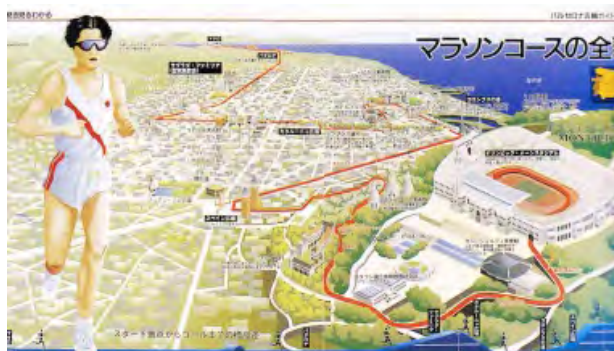
تصویر ۳. بازنمایی مسیر مسابقه دو مکان نهایی آن جهت راهنمایی عوامل برگزارکننده. هدف: اطلاع‌رسانی. مأخذ: www.paperproductmachines.com .

برخی بازنمایی‌ها در گرافیک عملکردی چندگانه مانند، هویت‌نمایی، اطلاع‌رسانی تبلیغاتی و تزئین دارند. روی جلد کتب، بروشورها یا بسته‌بندی یک محصول چنین عملکردی دارند