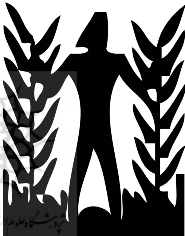
تصویر ۲. تصویر هویت سازمانی یک شرکت که ترکیبی از نشانه و رنگ با هم بازنمایی می‌شود. هدف: هویت‌نمایی و معرفی. مأخذ: www.paperproductmachines.com .