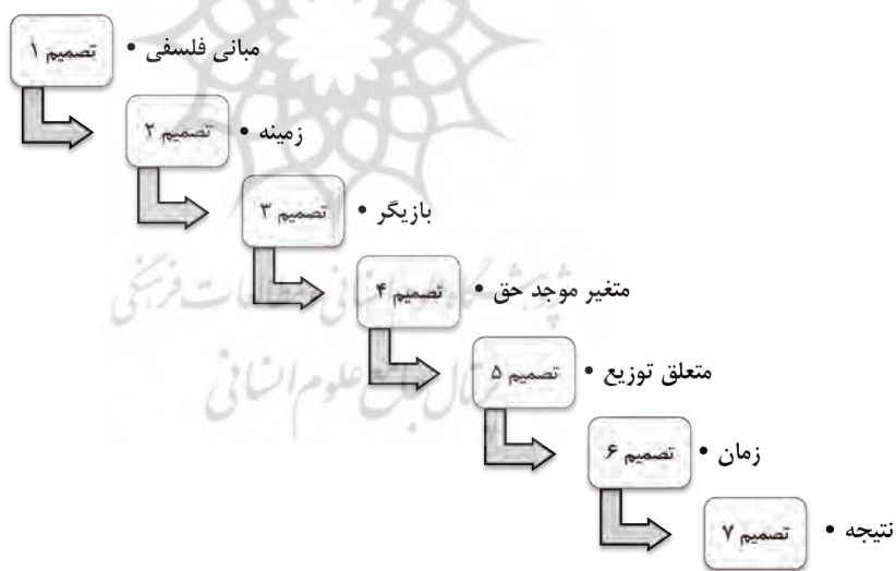
شکل شماره ۲. سیر اولویت‌های تصمیم در الگوریتم تحلیل موقعیت مسئله عدالت