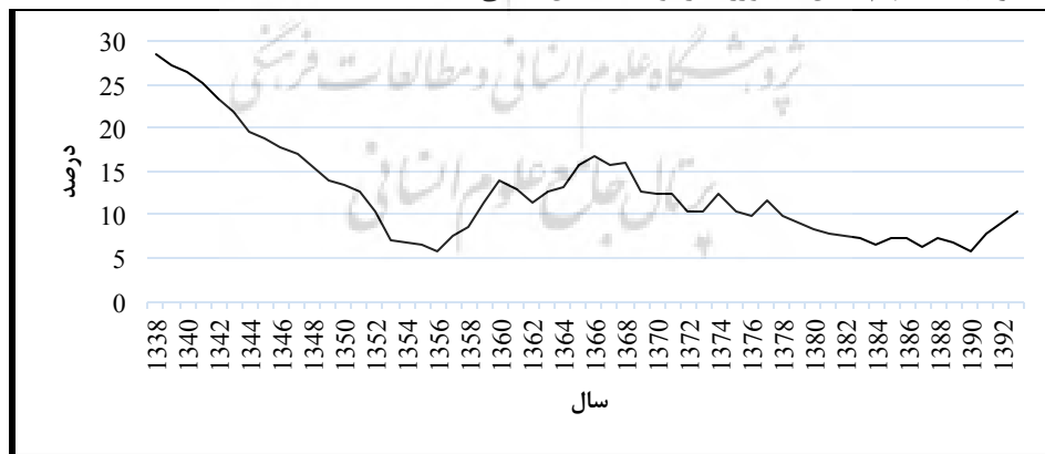
نمودار-۲. سهم بخش کشاورزی از تولید ناخالص داخلی