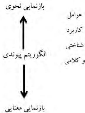
شکل ۱: نظام دستور نقش و ارجاع

الگوریتم پیوندی دوسویه تعامل میان بازنمایی نحوی و معنای را از دید گوینده (معناشناسی به نحو) و شنونده (نحو به معناشناسی) توصیف می‌کند. نکته حائز اهمیت این است که دوسویه بودن الگوریتم پیوندی به معنای گشتاری بودن فرایند پیوند نیست. به عبارت بهتر، هیچ نوع صورت روساختی و ژرف ساختی وجود ندارد. همچنین مفاهیم انتزاعی مانند PRO، ردها، افعال سبک و غیره در این دستور جایی ندارد. در حقیقت، دوسویه بودن پیوند میان بازنمایی‌های نحوی و معنایی امکان بررسی پاره گفتاری را از دو زاویه دید فراهم می‌سازد.