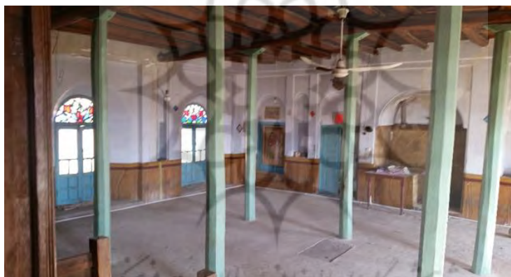
شکل شماره ۴: حسینیه بجانلی

وجود خانه‌های کاهگلی و خشتی و ساختمانهای قدیمی با معماری اصیل ایرانی- اسلامی گواه تاریخ و تمدن پرآوازه این آبادی می باشد. که با گذر در کوچه پس کوچه های آن بوی تلفیق سنت و مدرنیته به مشام می رسد و یادآور تاریخ گذشتگان بالآخر تاریخ قاجاریه و پهلوی و معماری آن روزگاران می باشد.