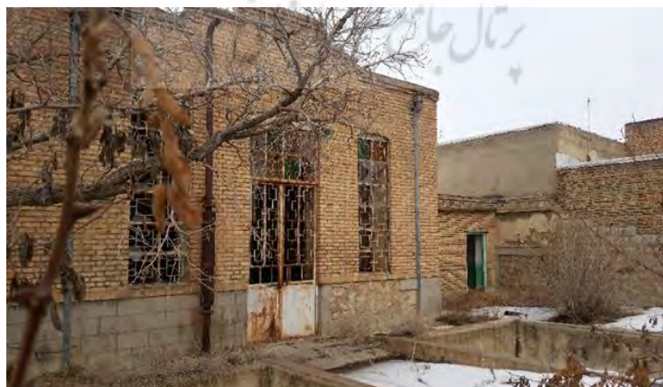
شکل شماره ۵: ساختمان اداره برق

با این اوصاف ارتباط این مناطق تاریخی و مراکز فرهنگی و هنری و آثار باستانی طبیعی ساخته شده در این شهر به نحو مطلوب نگهداری نشده و در طول زمان دست خوش تغییرات نامناسبی گردیده است. واز سویی تلاشی نیز جهت برقراری این ارتباط و تشکیل حلقه ی گردشگری شهر خامنه مستلزم تدوین و تهیه طرح های اجرایی، بازسازی، احیاء و نگهداری آثار