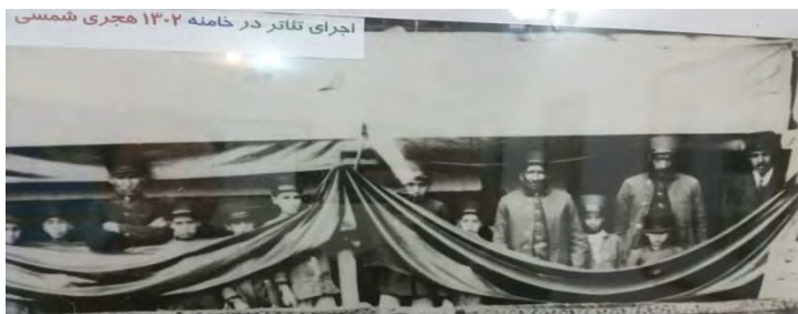
شکل شماره ۳: اجرای تئاتر در خامنه

مراسم فرهنگی، ملی و مذهبی، شبیه خوانی، تئاتر و آیین های سنتی شهر خامنه از قدیم الایام و در روزهای مشخصی سبب ورود گردشگران به این شهر در روزهای مشخصی می شود. بطوریکه براساس تصاویر و مدارک بدست آمده ، اولین تئاتر این شهر در سال ۱۳۰۲ و با عظمت و شکوه خاصی انجام می پذیرفت.