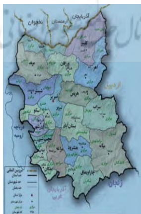
شکل شماره ۱: نقشه آذربایجان شرقی

شهر خامنه در استان آذربایجان شرقی و در بخش مرکزی شهرستان شیبستر و در ۷۲ کیلومتری غرب تبریز و ۵ کیلومتری غرب شیبستر و در مختصات جغرافیایی 38,11^{\circ} شمالی و 45,37^{\circ} شرقی واقع گردیده است. این شهر در کوهپایه های کوه میشوگسترده شده و شیب عمومی آن از شمال به جنوب می باشد که از سمت شمال به شهر دریان، از شرق به شیبستر، از جنوب به شندآباد و دریاچه ارومیه و از سمت غرب به شهر کوزه کنان و تسوج محدود و در ارتفاع ۱۳۸۰ متری از سطح دریا قرار گرفته است.