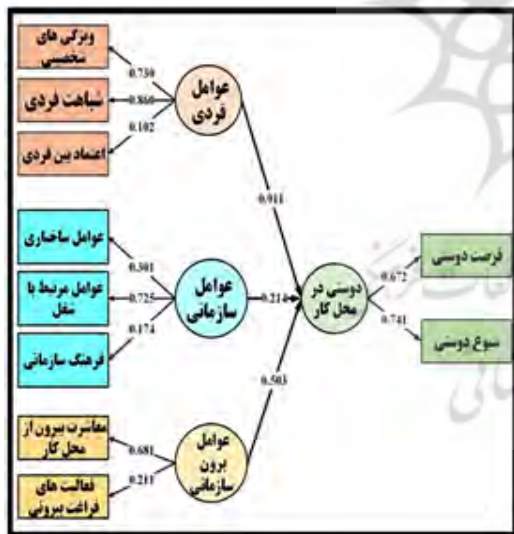
شکل ۲. الگوی ساختاری پژوهش

در شکل شماره (۲) الگوی معادلات ساختاری پژوهش آورده شده است.