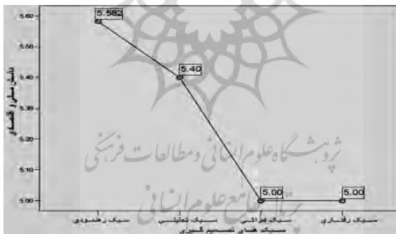
نمودار شمارهٔ ۲. نمودار میانگین دانش مالی و اقتصادی در بین چهار سبک تصمیم‌گیری

وجود ندارد و بر خلاف آن، فرضیهٔ مخالف حاکی از آن است که بین حرفه‌ای‌گرایی سرمایه‌گذاران با سبک‌های شناختی تصمیم‌گیری مختلف رابطه وجود دارد. آماره محاسبه‌شده آزمون مربع کا با مقدار (۳/۲۵۸) کوچکتر از آمارهٔ بحرانی (۷/۸۱۵) با درجهٔ آزادی سه در سطح ۰/۰۵ است. به عبارت دیگر سطح خطای محاسبه‌شده بزرگتر از ۰/۰۵ است. در نتیجه فرضیهٔ صفر در سطح ۹۵٪ اطمینان رد نشده و به عنوان فرضیه سالم حفظ شده است. بنابراین ارتباط معناداری بین حرفه‌ای‌گرایی سرمایه‌گذاران با سبک‌های شناختی تصمیم‌گیری مختلف وجود ندارد و این فرضیه تحقیق رد شده است. نتیجهٔ آزمون در جدول ۵ نشان داده شده است. برای استفاده از این آزمون باید چند مفروض بنیادی قابل توجیه باشد که مهم‌ترین آن صفر نبودن فراوانی مورد انتظار خانه‌های محل تقاطع و بیشتر نبودن بیست درصد خانه‌های محل تقاطع از مقدار پنج است. با توجه به برقراری شرایط اشاره‌شده نتیجه به دست آمده برای فرضیه قابل اتکا و اطمینان است.