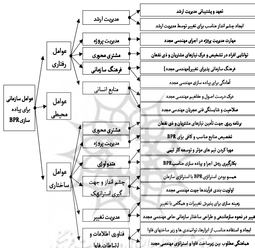
شکل ۲ مدل کلی پژوهش