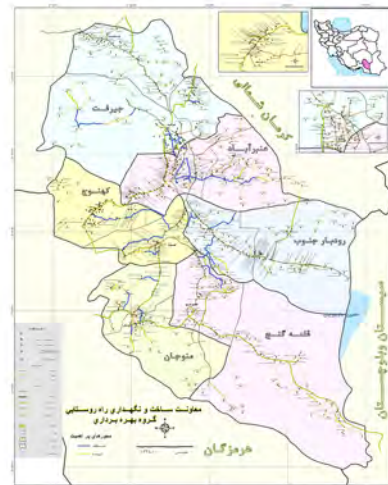
تصویر ۱. نقشه شهرستان منوجان

شهرستان منوجان با وسعتی در حدود هفت هزار کیلومتر مربع و با ضریب محرومیت هشت، در فاصله ۴۳۰ کیلومتری جنوب غربی شهر کرمان واقع شده است. این شهرستان از جنوب و غرب به ترتیب با شهرستان‌های میناب و رودان در استان هرمزگان و از شمال با شهرستان کهنوج و از شرق با شهرستان قلعه گنج همسایه است. جمعیت شهرستان منوجان ۶۴ هزار و ۵۲۸ نفر است؛ ۱۹ هزار و ۵۷۰ نفر شهرنشین و ۴۴ هزار و ۹۵۸ نفر روستائین. این شهرستان شامل ۲۹۵ پارچه آبادی است که به واسطه مسائل محیطی و اقتصادی و اجتماعی، در حال حاضر ۱۴۸ پارچه آبادی آن خالی از سکنه است.