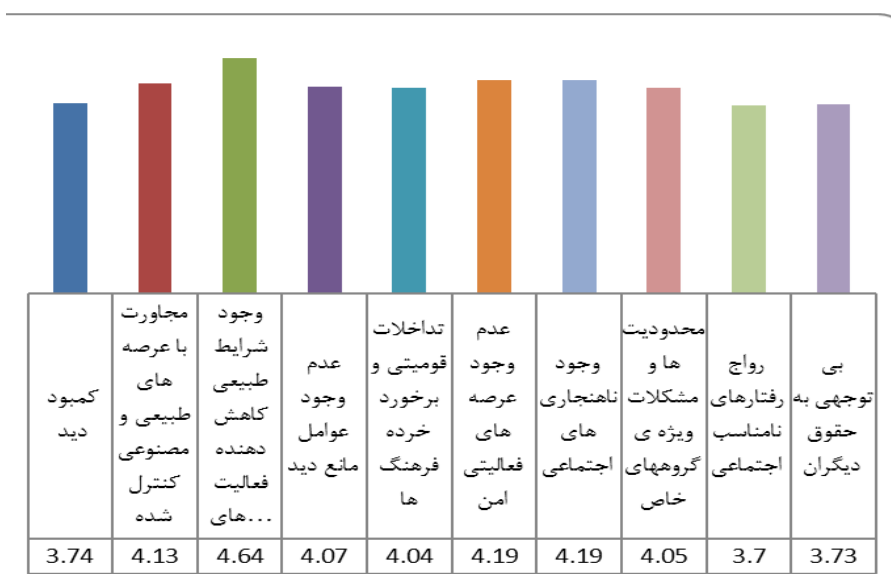
شکل ۳- میانگین رابطه بین عوامل کاهش امنیت پارک‌ها و میزان جرم، منبع: یافته‌های تحقیق، ۱۳۹۴

توجهی به حقوق دیگران) با میانگین ۳/۷۰، کمبود دید (در اثر کمبود نور، عوارض طبیعی، مه‌گرفتگی و ... ) با میانگین ۳/۶۴، بالاترین و پایین‌ترین رتبه را به خود اختصاص داده‌اند.