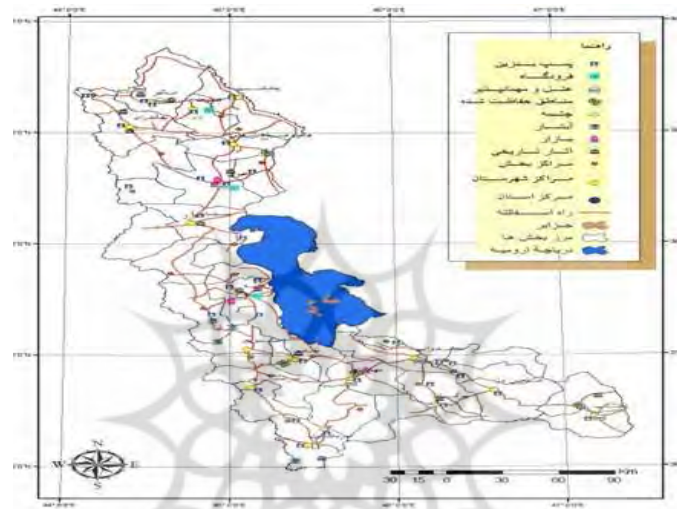
شکل (۲) نقشه گردشگری استان آذربایجان غربی

شرق به آذربایجان شرقی و زنجان محدود است و براساس آخرین تقسیمات سیاسی، استان در سال ۱۳۹۰ دارای ۱۷ شهرستان، ۴۰ بخش، ۴۲ شهر، ۱۱۳ دهستان و ۳۰۳۱ آبادی دارای سکنه است.