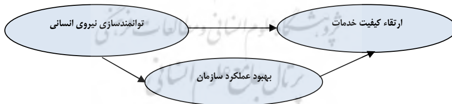
شکل (۴) توانمندسازی نیروی انسانی سازمانی

علامت اختصاری جهت به‌کارگیری شایستگی‌های مسئولان در روش‌های خلاق و نوآور در اکثر جنبه‌های عملکردی می‌باشد. کشورهای پیشرو در عرصه گردشگری، کشورهایی هستند که همواره با توانمندسازی نیروهای انسانی، شایستگی‌های حال و آینده تصمیم‌گیران خود را جهت به اجرا درآوردن استراتژی‌ها، اهداف و برنامه‌های بلندمدت شناسایی نموده و جهت دستیابی به موفقیت، به توسعه همکاری‌ها می‌پردازد.