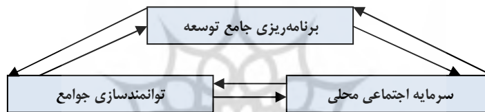
شکل (۳) پیشبرد فرهنگ مشارکت محلی از طریق توانمندسازی جوامع. مأخذ: (Strzelecka, 2012)

جوامع، مورد توجه بوده و زیر بنای این امر، سازماندهی اجتماع محلی است که نیازمند بسیج قابلیت‌های درونزای اجتماع است. گردشگری مبتنی بر اجتماع محلی، به دنبال توانمندسازی مردم، افزایش مشارکت ساکنان در فرایند تصمیم‌گیری و توزیع درآمد گردشگری می‌باشد؛ به‌ویژه منابع مالی منطقه‌ای و محلی باید برای ایجاد جامعه‌ای خودکفا استفاده شود و برنامه‌ریزی و مدیریت بر مؤثرترین شیوه استقرار سرمایه انسانی محلی و دیگر منابع در کنار استفاده از دانش بومی اجتماع محلی و ابزار غیر رسمی در برنامه‌ریزی با حمایت مقامات منطقه‌ای و کشوری متمرکز شود.